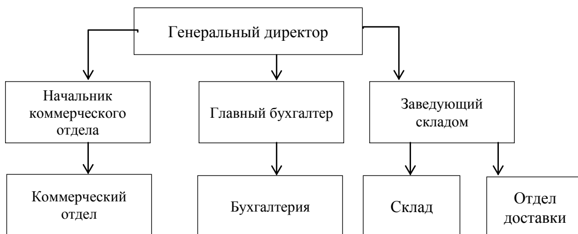
Рисунок 2.1 – Организационная структура управления ООО «ДВРЗ», 2018 г.

Организационная структура управления ООО «ДВРЗ» представлена на рисунке 2.1.