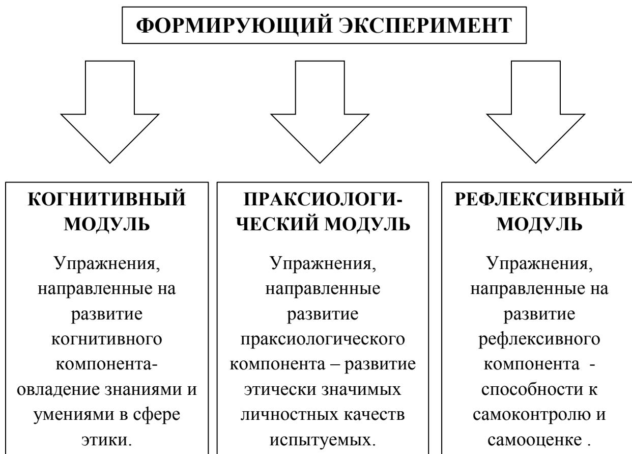
Рис. 3 – Структура формирующего этапа эксперимента

взаимосвязь морали и права, нужно обратить особое внимание на общие черты этих двух феноменов культуры, а затем подчеркнуть их различие.