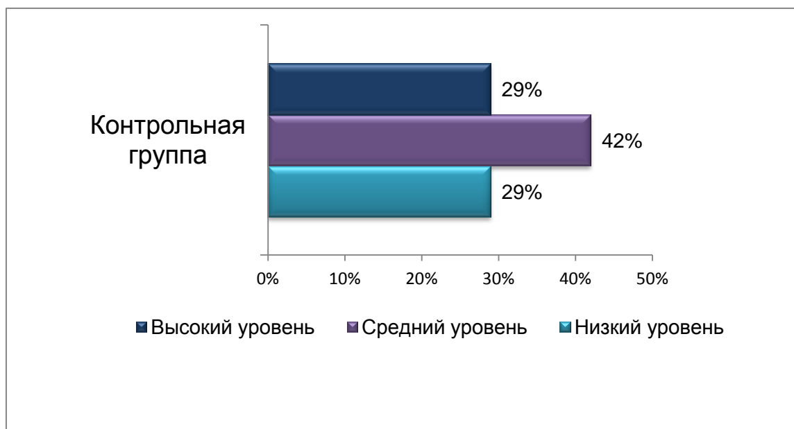
Рис. 3 - Общий уровень сформированности этических умений у студентов контрольной группы на контрольном этапе

Испытуемые контрольной группы не подверглись радикальным изменениям.