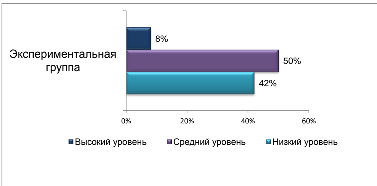
Рис. 4 - Общий уровень сформированности этических умений у студентов экспериментальной группы на контрольном этапе

В экспериментальной группе количество студентов с высоким уровнем увеличилось на 21%, средний уровень вырос на 7%. А число студентов с низким уровнем уменьшилось на 28%.