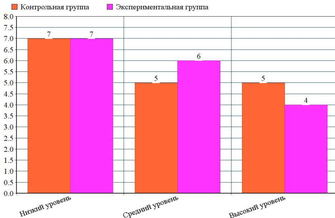
Рисунок 1 – Количественные результаты констатирующего эксперимента

Дальнейшая деятельность будет ориентирована на формирование связной речи в ходе ознакомления с сезонными явлениями у детей 5-6 лет экспериментальной группы.