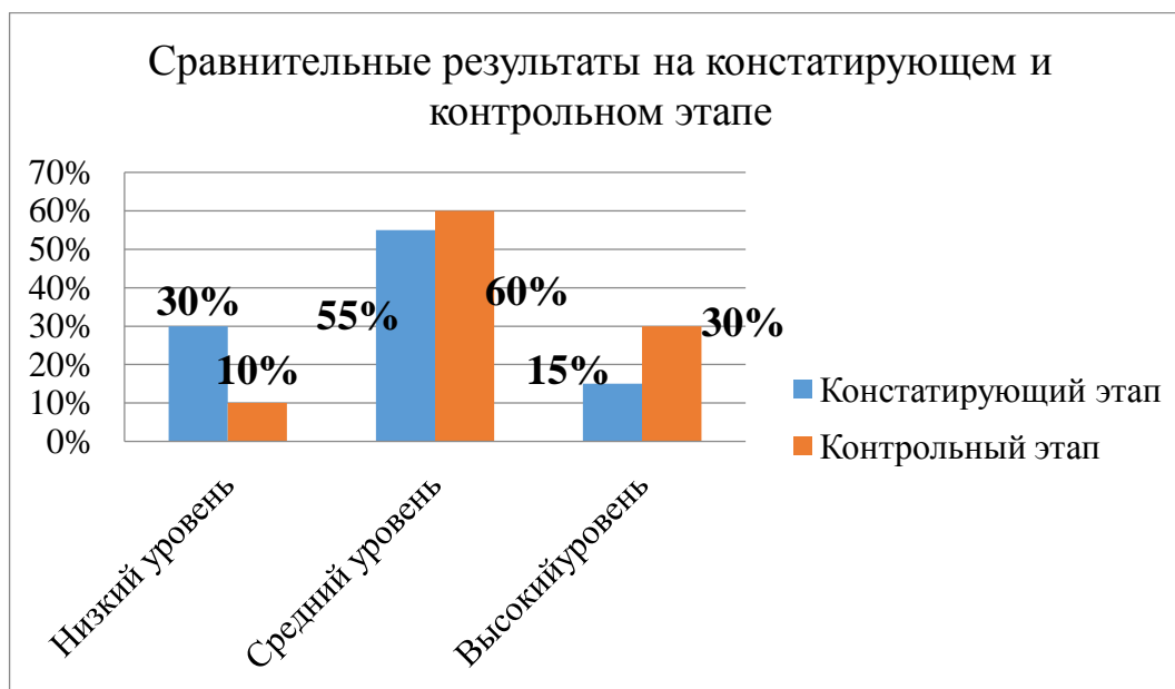
Рисунок 2 – Сравнительные результаты диагностики детей на констатирующем и контрольном этапе

Сравнительные данные диагностики общего уровня сформированности у детей 6-7 лет навыков самоконтроля на констатирующем и контрольном этапах эксперимента представлены на рисунке 2.