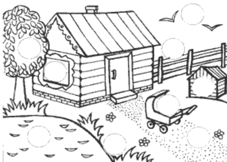
Рисунок 1 – Стимульный материал к методике «Где чье место?»

На рисунке видны прорисованные пустые круги, для диагностики по этой методике необходимы кружочки такого же диаметра с нарисованными внутри картинками, фигурками каких-либо персонажей. Эти персонажи должны подходить к определенному кругу на сюжетной картинке.