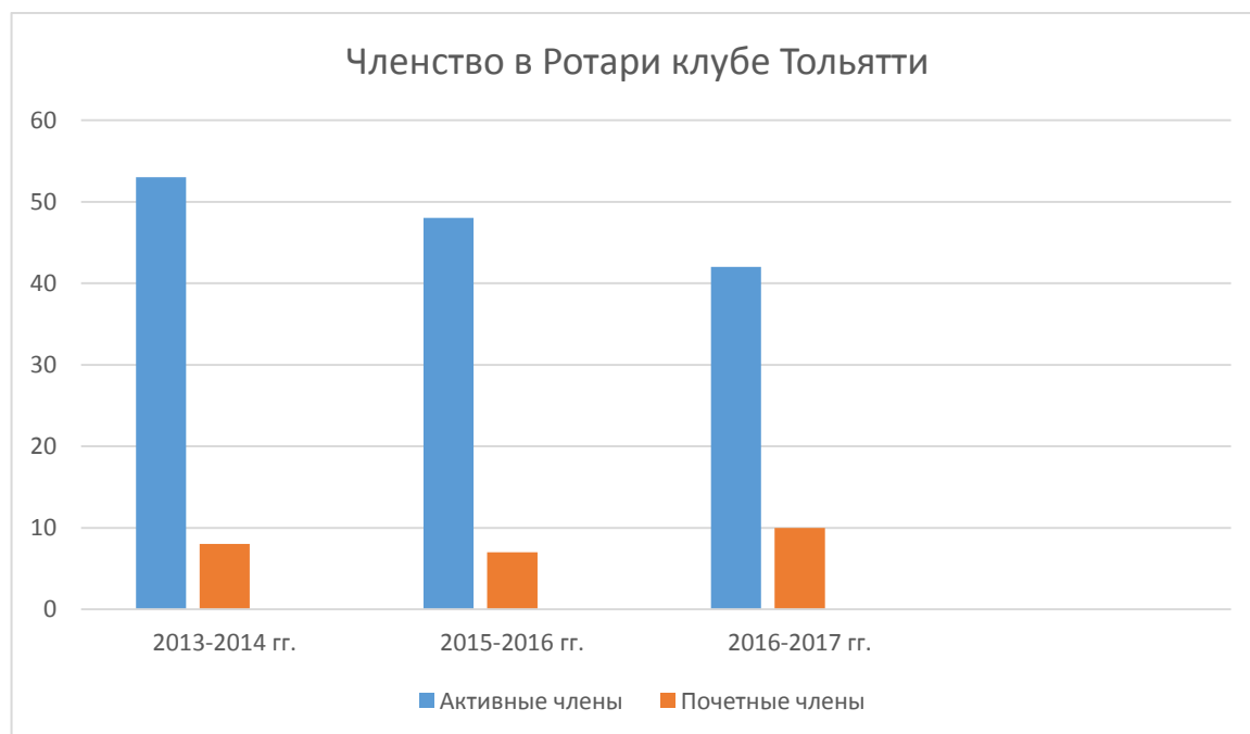
Диаграмма 1. «Изменение членства в Ротари клуб Тольятти за период 2013-2017 гг.» 104