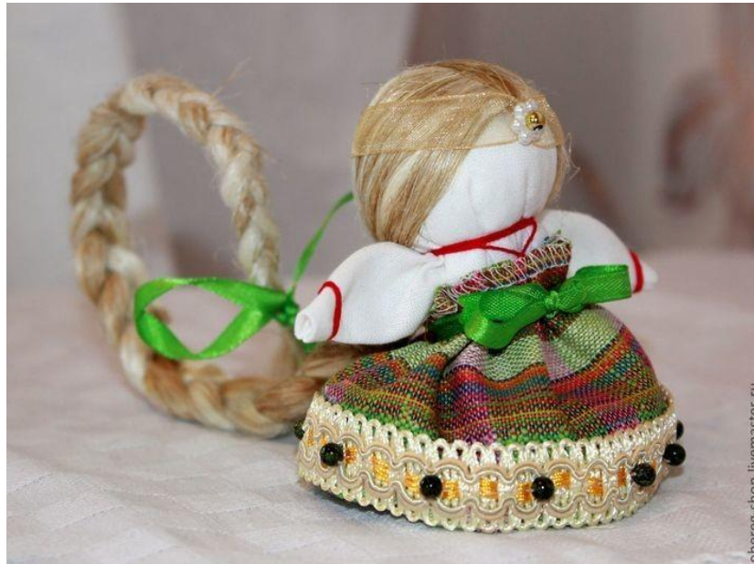
Рисунок 5 – Кукла «Счастья»

Для организации третьего (деятельностного) этапа, с целью стимулирования коммуникативной и творческой деятельности детей 6-7 лет с общим недоразвитием речи III уровня через тематическую выставочную площадку, нами организовывались занятия «Моя кукла», «В мире сказочных героев» и организация персональных и тематических выставочных площадок.