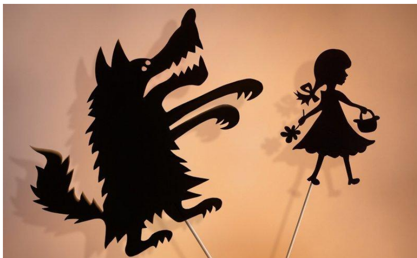
Рисунок 2 – Куклы, применяемые во время занятия «Застенчивое королевство»