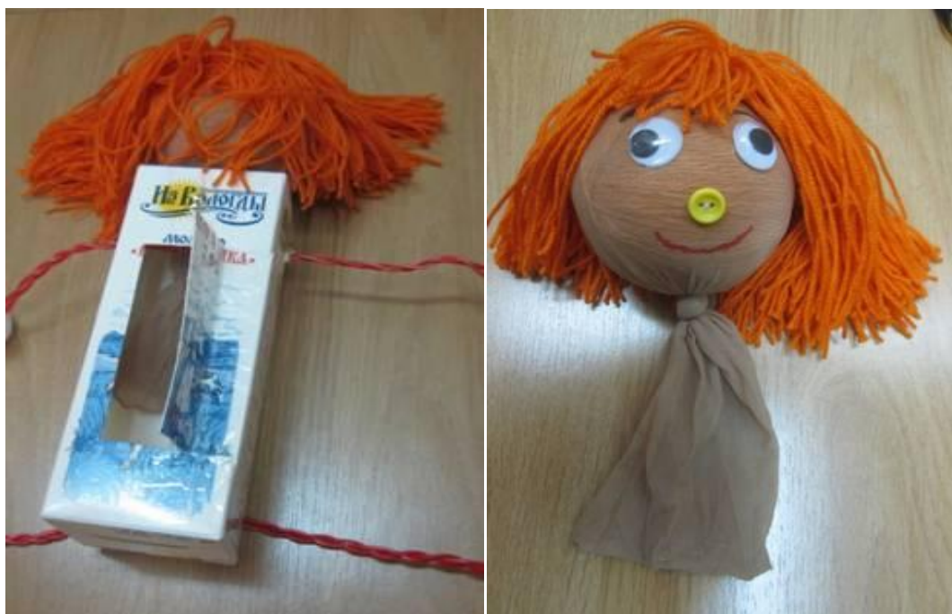
Рисунок 3 – Изготовление куклы «Страшки»