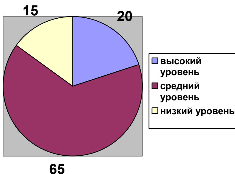
Рисунок №1: Констатирующий эксперимент на уровень художественно-творческого развития детей 6-7 лет в дошкольной образовательной организации.

После выявления уровня развития художественно-творческого развития у детей 6-7 лет, мы выбрали два уровня высокоэффективного методического сопровождения художественно-творческого развития детей 6-7 лет.