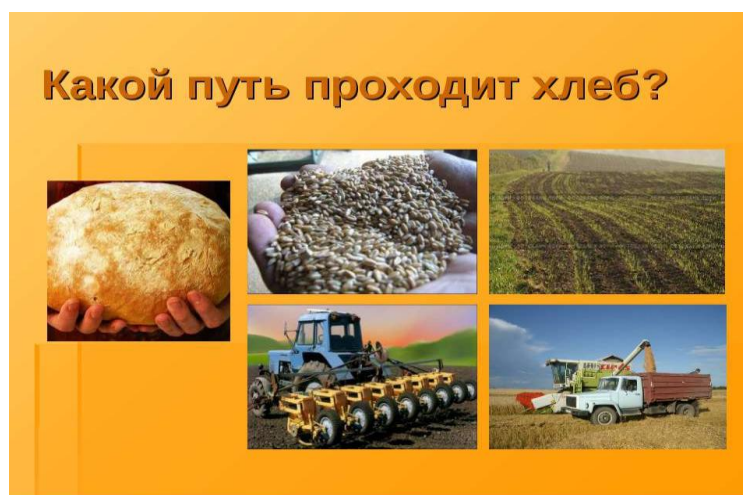
Рисунок 1 – Стимульный материал к методике 3

Нами была составлена следующая картинка.