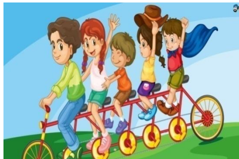
Совместная игра детей