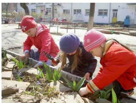
Совместный труд детей