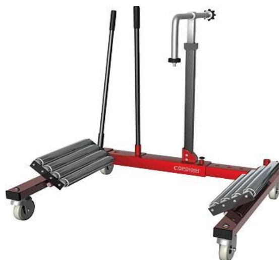
Рисунок 2.5 – Тележка Silverline

Передвижные или параллелограммные подъемники состоят из двух горизонтальных трапов с закрепленными под ними шарнирными конструкциями. Колесо устанавливается на платформе. Последние поднимаются путем подтягивания конца одного из двух соединенных посередине элементов при помощи гидравлической или гидропневматической системы.