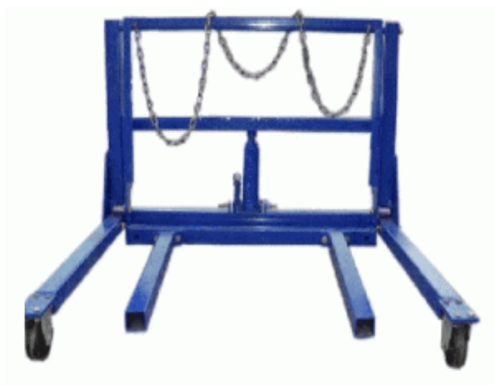
Рисунок 2.3 – Телега для перевозки спаренных колес ХН-5D