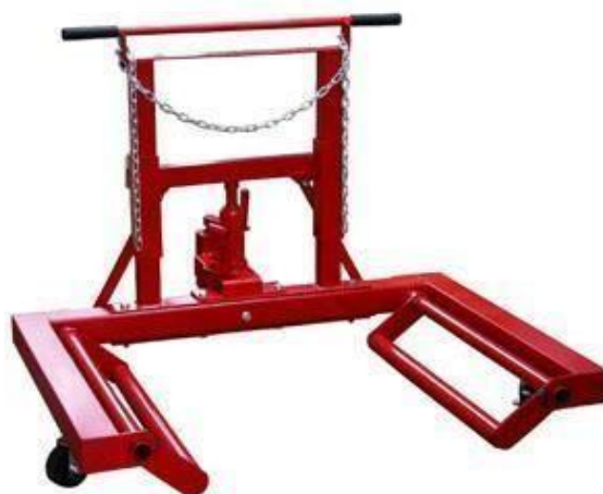
Рисунок 2.7 – Подъемно-транспортная тележка N3101