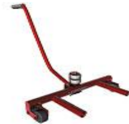
Рисунок 2.2 – Тележка для транспортировки колес, 9.63