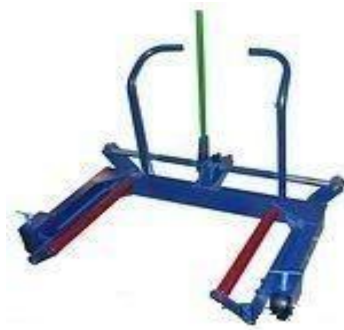
Рисунок 2.4 Подъемно-транспортное устройство «ТМ-254»

В качестве примера приведен вариант подъемника типа тележка для подъема и перевозки колес «ТМ-254».