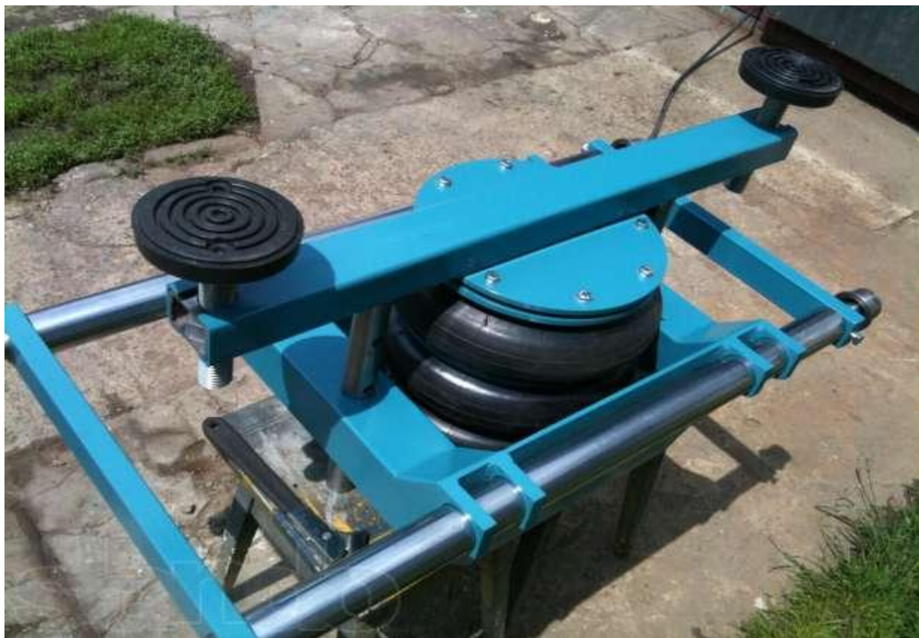
Рисунок 2.4 - Вид подъемника ПП-2

Ножничные или параллелограммные автоподъемники состоят из двух горизонтальных трапов с закрепленными под ними шарнирными конструкциями. Автомобиль устанавливается на платформе. Последние поднимаются путем подтягивания конца одного из двух соединенных посередине элементов при помощи гидравлической или гидропневматической системы.