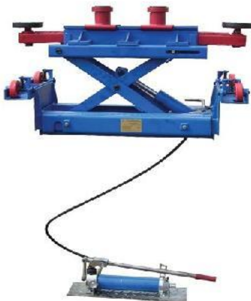
Рисунок 2.5 - Ножной привод подъемника

Подъемник для автомобилей и агрегатов напольный, складывающегося типа, передвижной, с электроприводом гидравлического насоса. Ножничная конструкция подъемника ПНК-1-01, обеспечивает наибольшую грузоподъемность до 4 т. Предназначен подъемник - для проведения работ по ремонту и обслуживанию автомашин в мастерских, связанных с кузовными, окрасочными, а также шиномонтажными работами.