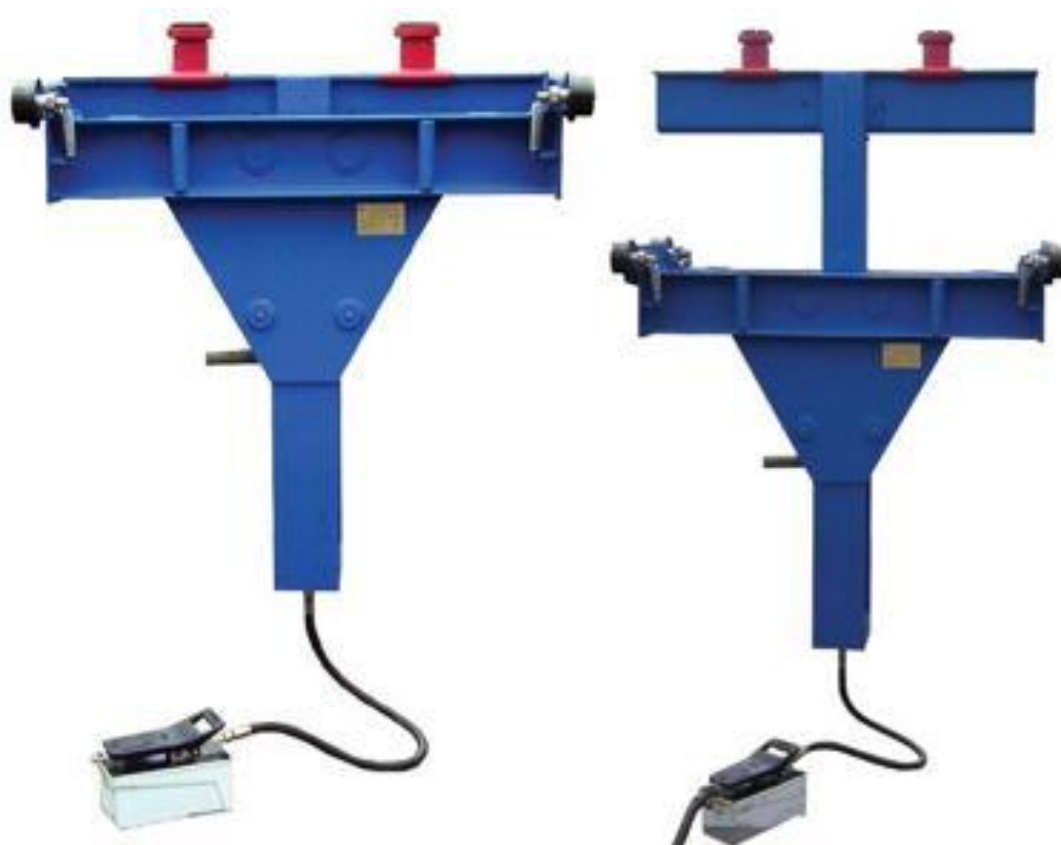
Рисунок 2.6 – Рабочее положение подъемника