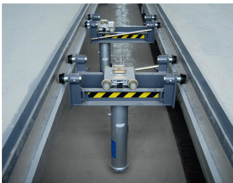
Рис. 2.3 - Элементы гидроподъемника