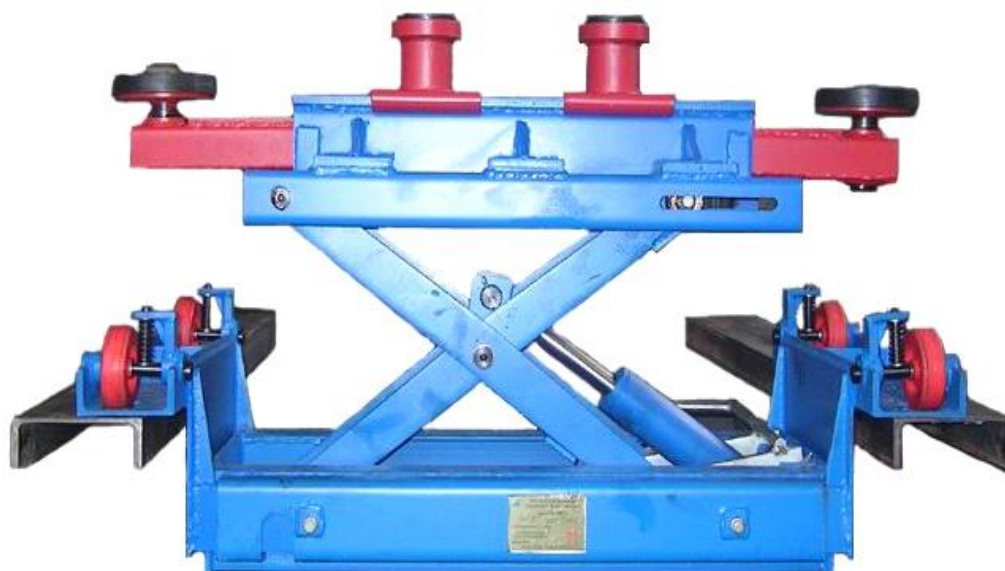
Рисунок 2.2 – Канавный подъемник ПНК-1-01