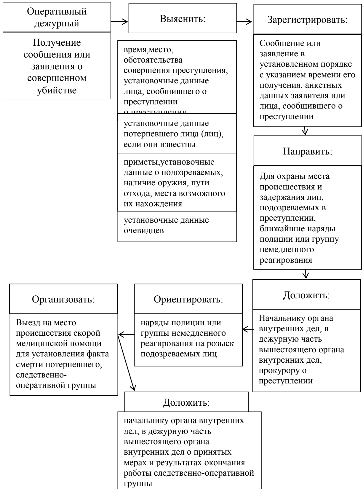
Рис. 3 – Предложенный алгоритм действий оперативного дежурного при поступлении сообщений об убийстве

Таким образом, возможна алгоритмизация всех действий оперативных дежурных при поступлении сообщений о преступлении.