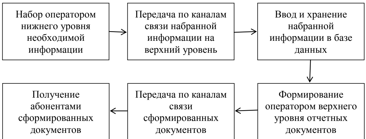
Рис. 2 - Предложенный алгоритм обработки информации при наличии централизованной базы данных в органах внутренних дел Самарской области

Развитие средств вычислительной техники и автоматизация деятельности ОВД приводит к разработке ведомственных автоматизированных информационных систем (далее – ВИС), которые позволяют систематизировать документы дежурной части по видам и содержанию. Это позволяет ранжировать нагрузку на оперативный дежурных, определять интегральные показатели объединенных информационных потоков, подстроить модели потоков документов в работе дежурной части. В конце все это позволит построить алгоритм деятельности сотрудников дежурной части при работе с документами, который представлен на рис. 2.