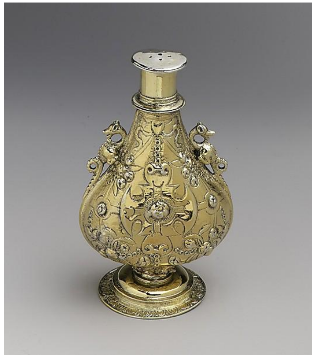
Рисунок 2. Флакон. Англия. XVI в. Музей Метрополитен.