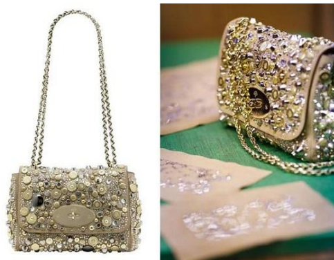
Рисунок 13. Сумочка от бренда Mulberry с кристаллами Сваровски.