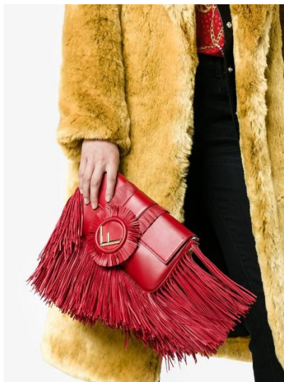
Рисунок 15. Сумки с бахромой от Valentino, Gucci и Fendi.