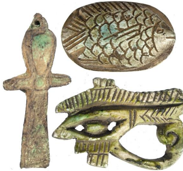
Рисунок 1. Амулеты древнего Египта.