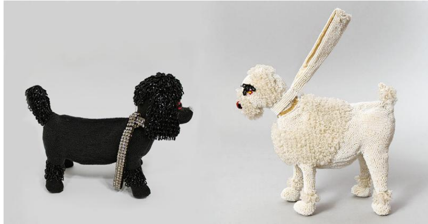
Рисунок 3. Коллекция сумок «Walborg Poodle» дизайнера Хильды Вальборг.