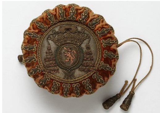
Рисунок 1. «Радикюль» 18 века.