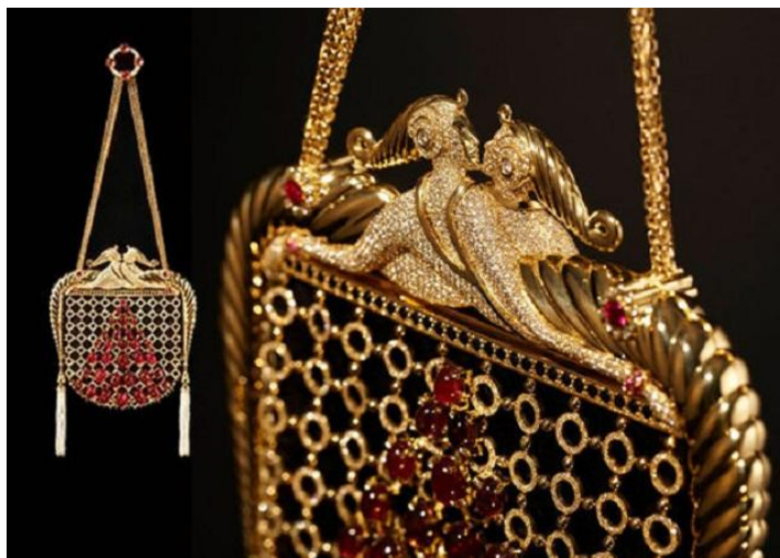
Рисунок 6. Сумочка «Claps» ювелира Стефано Кантури.