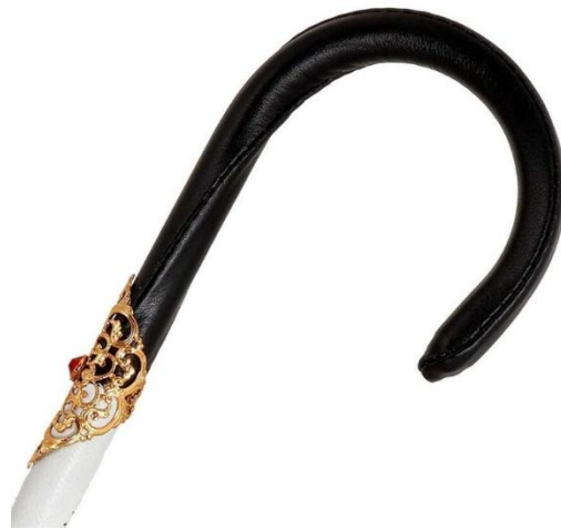
Рисунок 10. Зонтик Il Marchesato с кристаллами от Сваровски для Schirm Oertel.