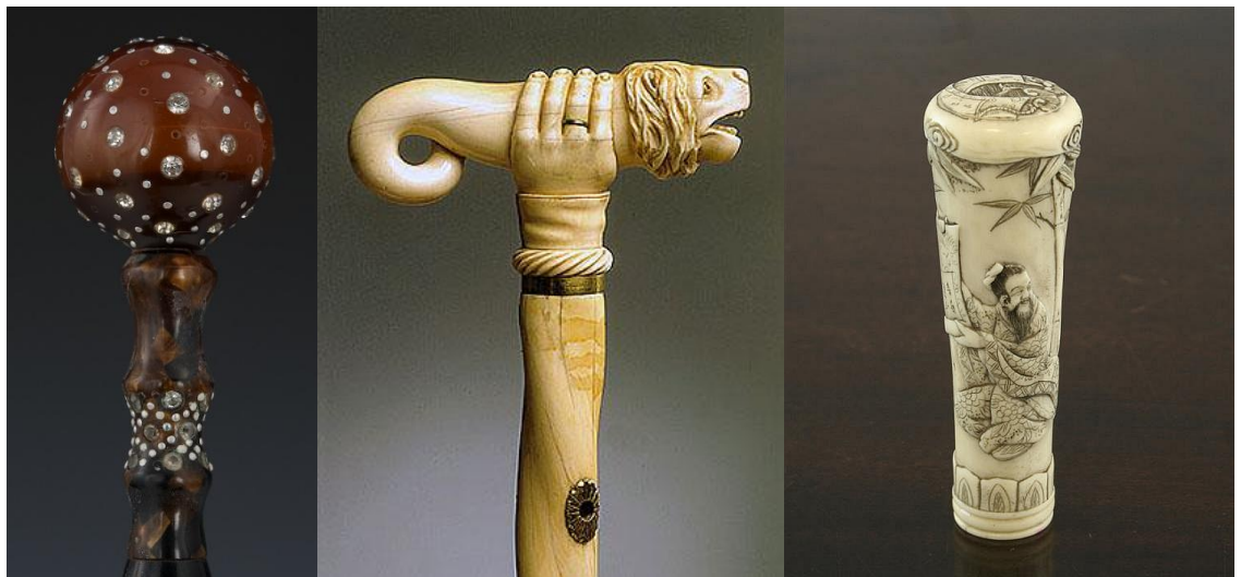
Рисунок 8. Рукояти зонтов из дерева и кости.