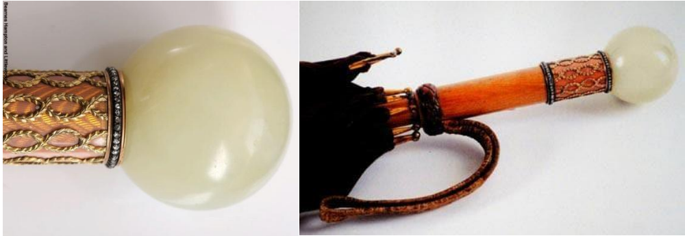
Рисунок 9. Ручка зонта из красного дерева с позолоченным узором и шаром из боуэнита. Карл Фаберже, XX век.