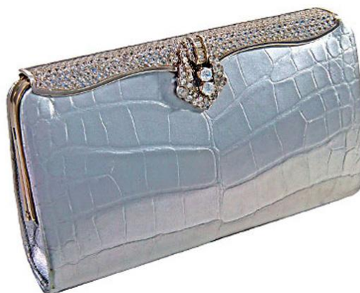
Рисунок 8. «Cleopatra Clutch» от бренда Lana Marks.