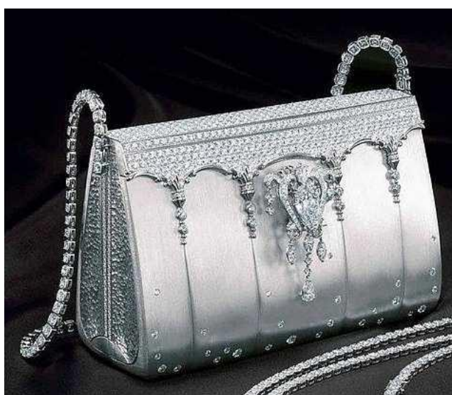
Рисунок 11. Сумка «Platinum Handbag» от дизайнера Гинзы Танака.