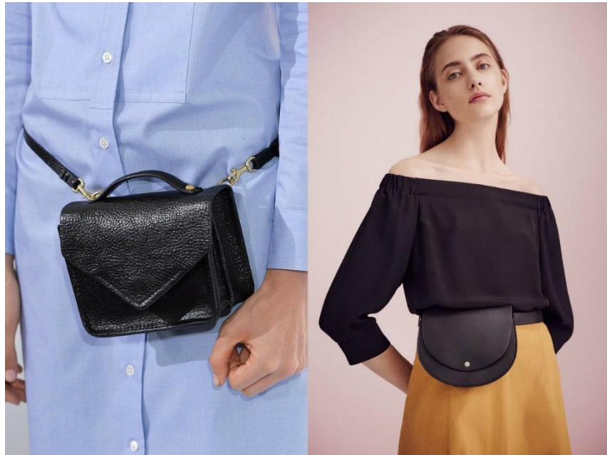
Рисунок 4. Классические сумки на пояс.