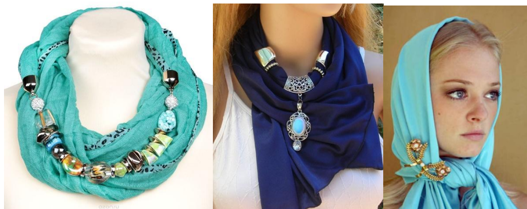
Рисунок 4. Декор на шарфах.