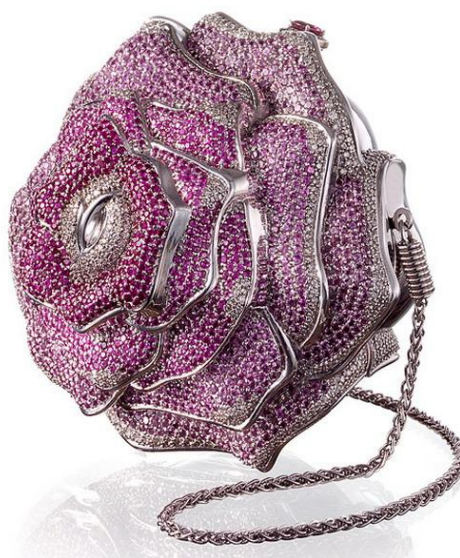
Рисунок 7. Сумочка «Precious Rose» от дизайнера Джудит Либер.