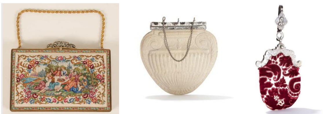
Рисунок 13. Сумочки-минодьеры с фермуаром.