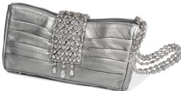
Рисунок 9. Сумочка дизайнера Кейт Адер, для ювелирной выставки «Red Carpet Jewelry Preview».