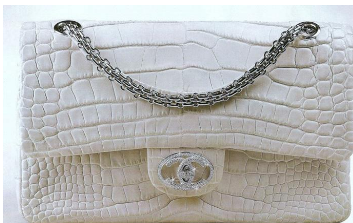
Рисунок 10. Сумочка «Diamond Forever» от модного дома Chanel.