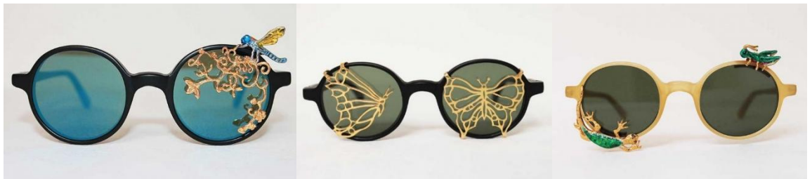
Рисунок 7. Очки иранской художницы Авиш Хебрезадех.