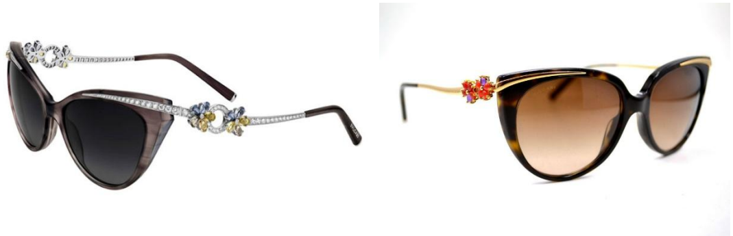
Рисунок 6. Солнцезащитные очки из коллекции «Le Gemme» от ювелирного дома Bvlgari.