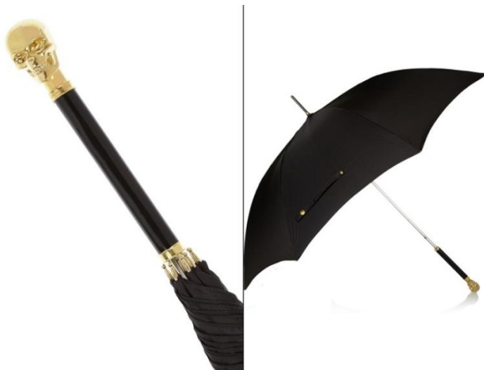
Рисунок 11. Зонтик от бренда Alexander McQueen.