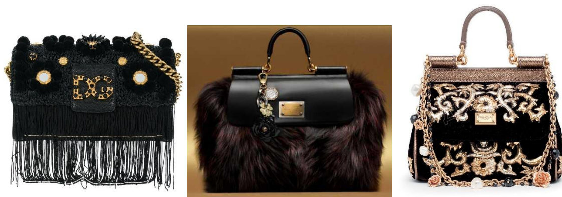
Рисунок 14. Сумки от бренда Dolce &amp; Gabbana.