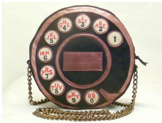
Рисунок 2. Сумка в форме дискового телефона от Эльзы Скиапарелли.