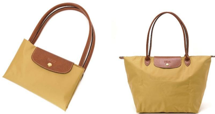
Рисунок 5. Сумка-трансформер «Le Pliage», от компании Longchamp.