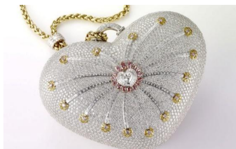
Рисунок 15. Сумочка ювелирного дома Mouawad, по дизайну Роберта Муавада.