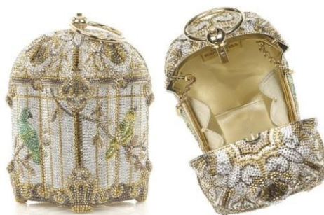
Рисунок 14. Сумочка от бренда Judith Leiber