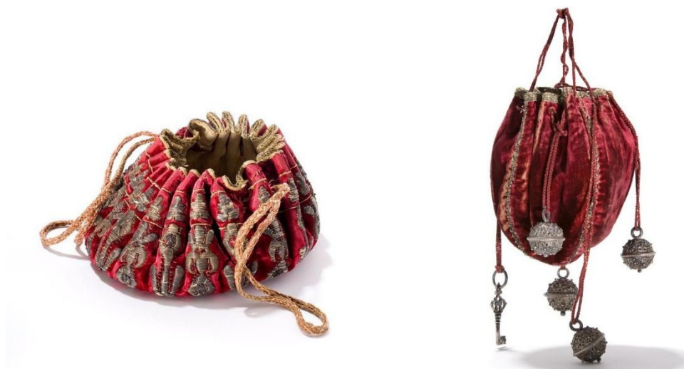
Рисунок 12. Сумочки-кисеты эпохи рококо.