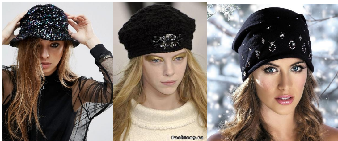
Рисунок 3. Декор на головных уборах.