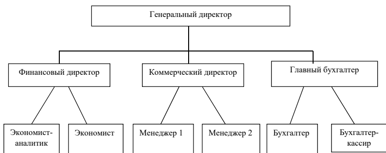
Рис. 1. Организационная структура управления предприятием

Нумерация формул должна быть сквозная по всей работе, арабскими цифрами. Формулы, следующие одна за другой и не разделенные текстом, отделяют запятой.