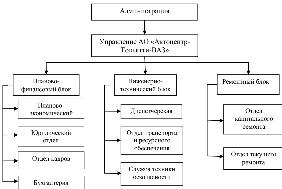
Рисунок 1. Организационная структура АО «Автоцентр-Тольятти-ВАЗ»

К основным цехам относятся: автоколонна, участок технического обслуживания, слесарно-механический участок. К вспомогательным цехам относится участок ремонтной зоны. К обслуживающему хозяйству относятся: склады запасных частей, материалов, инструмента и топлива.