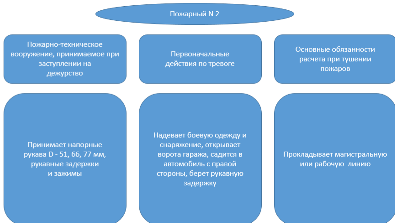
Рисунок 5 - Обязанности пожарного №2