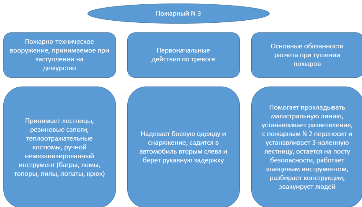
Рисунок 6 - Обязанности пожарного №3