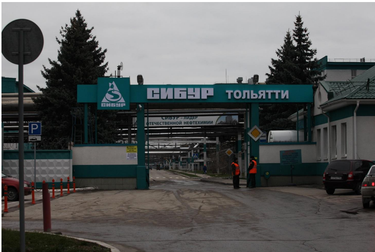
Рисунок 2 - Главная проходная ООО «СИБУР Тольятти»

каучука. По свойствам применяемых продуктов цех относится к взрывоопасной категории «А» [21].