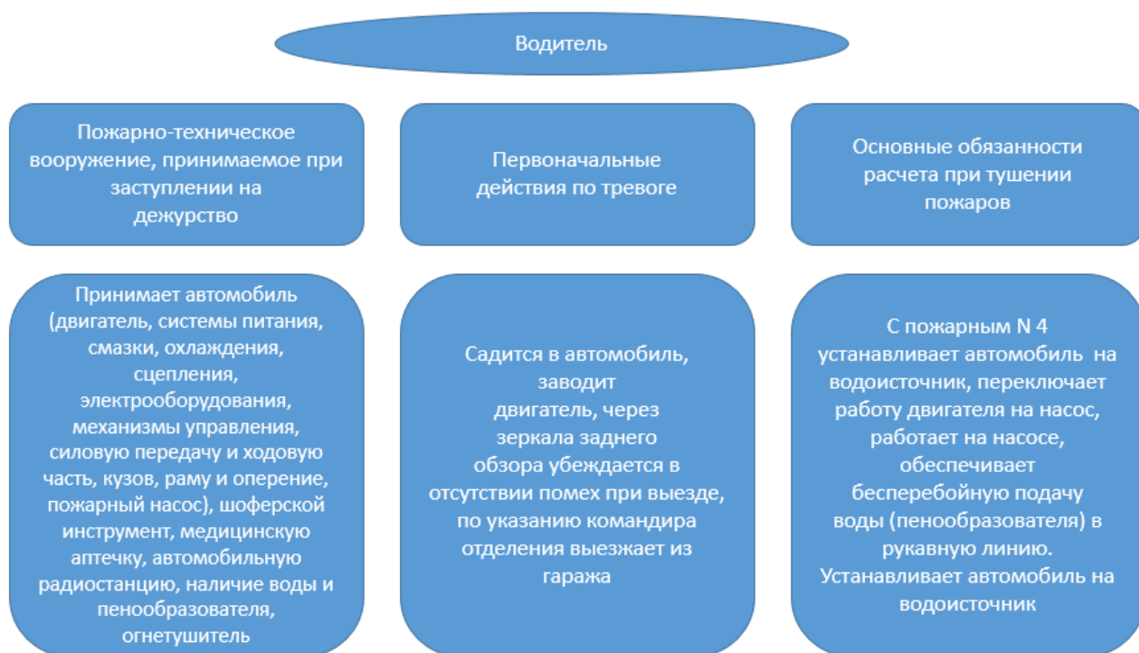
Рисунок 8 - Обязанности водителя пожарного автомобиля

Примечание: в типовой таблицей основных обязанностей личного состава отделений караула могут вноситься дополнения в зависимости от штатной численности личного состава в подразделении пожарной охраны и оснащённости пожарно-техническим вооружением техники. Резервная пожарная техника принимается командиром отделения, водителями и пожарными, назначенными начальником заступающего караула, согласно составу расчета.