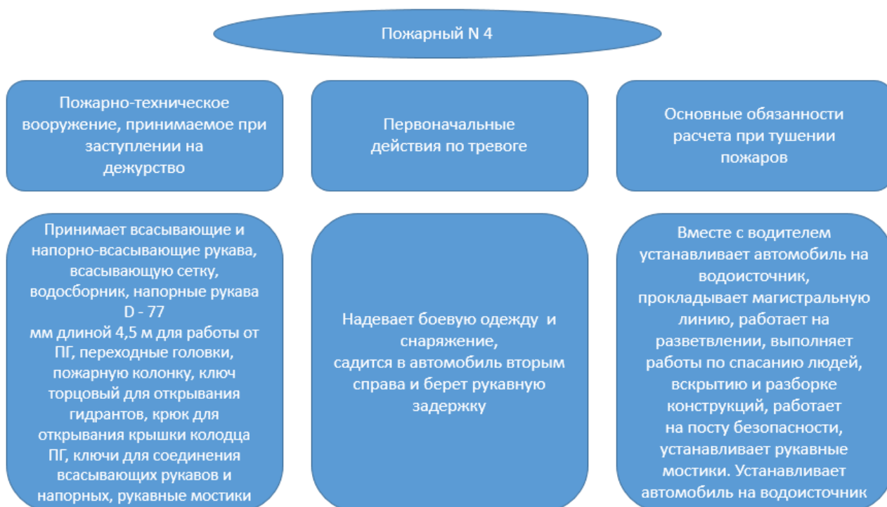
Рисунок 7 - Обязанности пожарного №4