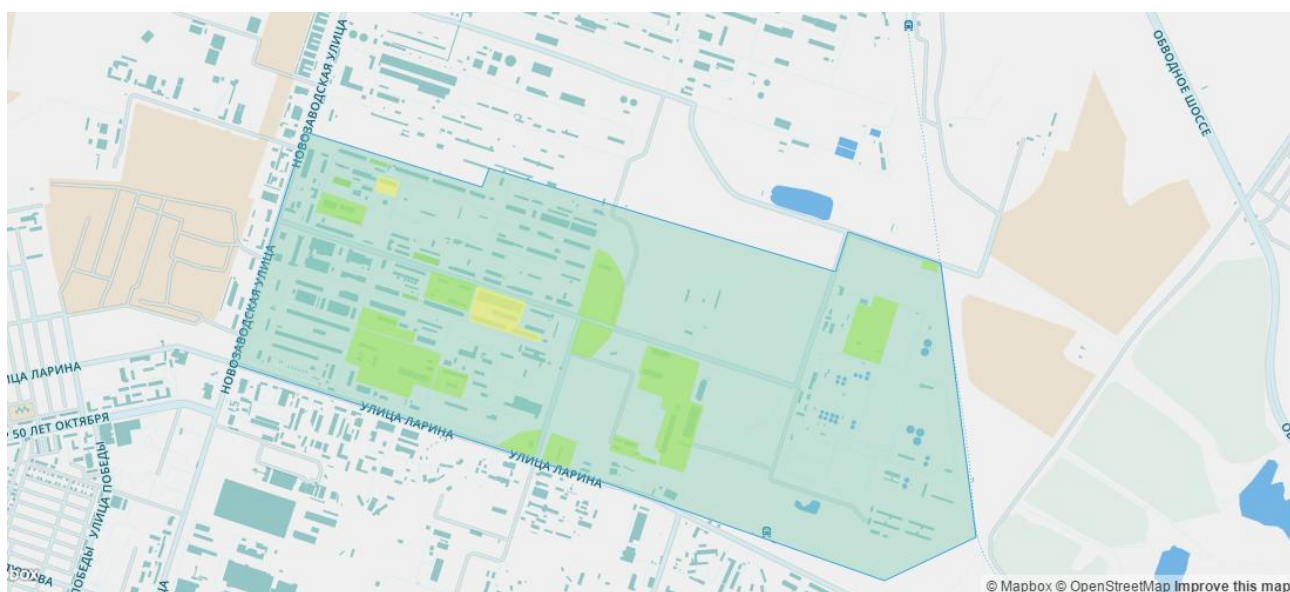
Рисунок 1 - Территория ООО «СИБУР Тольятти»

ООО «СИБУР Тольятти» - одно из крупнейших предприятий нефтехимического комплекса России, расположенное по ул. Новозаводская, 8 в Центральном районе города Тольятти, Самарской области в пяти километрах от административного центра города и занимает площадь 280 га с коэффициентом застройки 0,8 (рисунок 1). Граничит с северной стороны с ТО ТЭЦ, с восточной стороны - поливные участки, с западной стороны - административная зона, с южной стороны - территория ОАО «Волгоцеммаш» [21]. На рисунке 2 изображена центральная проходная.