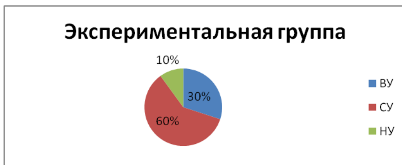
Рисунок 2 – Результаты контрольного эксперимента в ЭГ

Количественные результаты контрольного эксперимента представлены на рисунке 2.