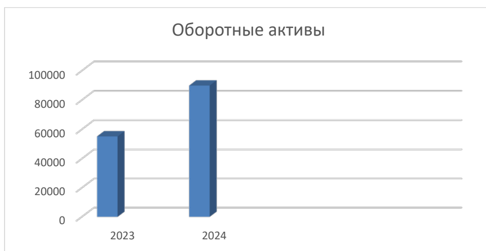
Рисунок 2 – Оборотные активы ООО «Бирюза»

Организация демонстрирует рост и сохраняет финансовую устойчивость благодаря преобладанию собственного капитала. Однако сложившаяся структура активов, характеризующаяся недостатком денежных средств и ростом неопределенных оборотных активов, требует более глубокого анализа для оценки реальных рисков ликвидности и финансового качества текущих операций. Появление долгосрочного кредита в 2024 году говорит о переходе к новой фазе развития, возможно, связанной с инвестициями.