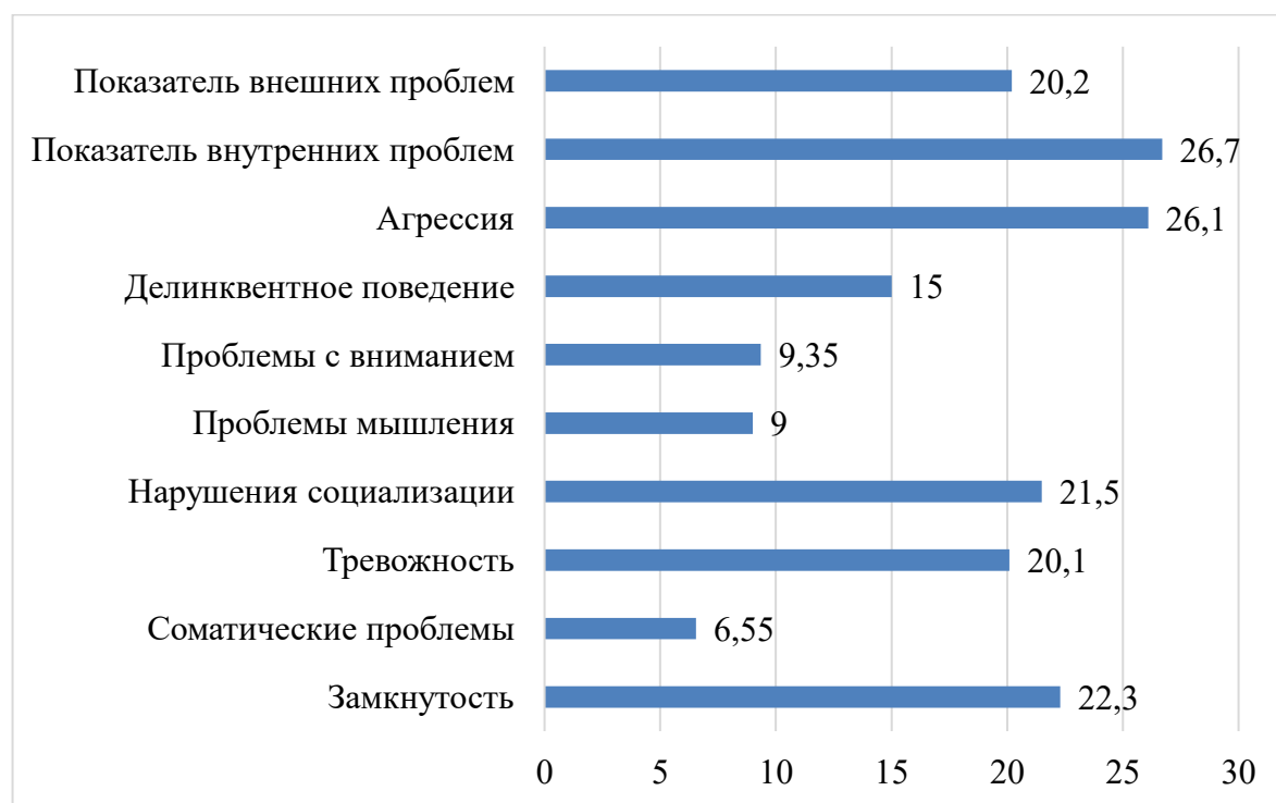
Рисунок 2 – Результаты исследования поведения подростков из неполных семей по методике Т.М. Ахенбаха

подросткового «бунта», переоценки ценностей, сложностей вторичной социализации.