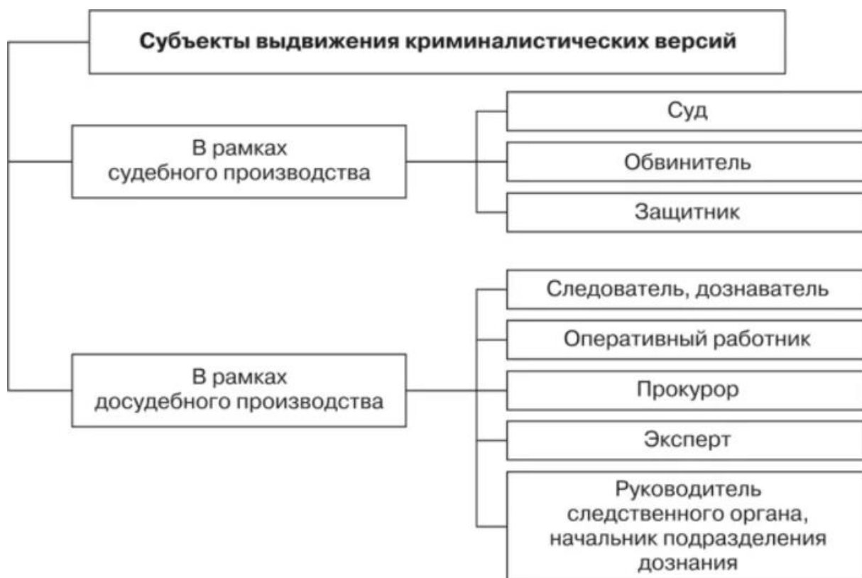
Рисунок Д.1 – Субъекты выдвижения криминалистических версий