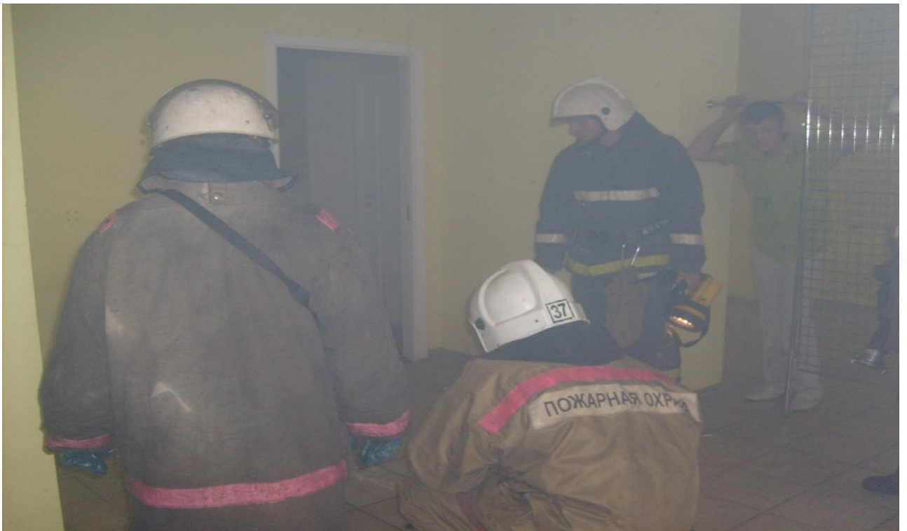
Рисунок 4 – Задымление магазина первого этажа

В случае же, если данные коммуникации будут изготовлены из полимерного материала, то может произойти переход пламени и продуктов горения через технологические проемы между помещениями библиотеки и жилыми квартирами, что повлияет на увеличение площади пожара, ущерба от самого пожара и его опасных факторов, а так же может привести к гибели жильцов, которые проживают на втором этаже жилого дома непосредственно над библиотекой.