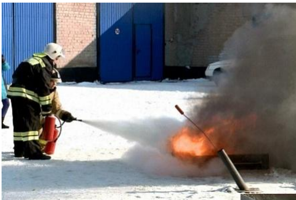
Рисунок 5 – Отработка навыков пожаротушения огнетушителями

Так, 19 февраля 2016 года на базе производственно-технического центра федеральной противопожарной службы по Оренбургской области состоялся семинар-совещание, организованный министерством социального развития совместно с региональным управлением МЧС России (рисунок 5).