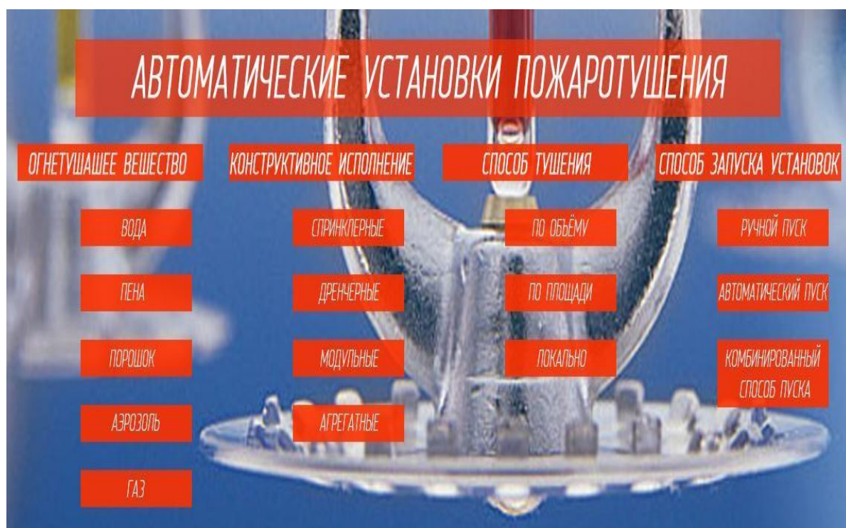
Рисунок 1 – Виды автоматических установок пожаротушения

Классификацию автоматических установок пожаротушения можно рассмотреть на рисунке 1.