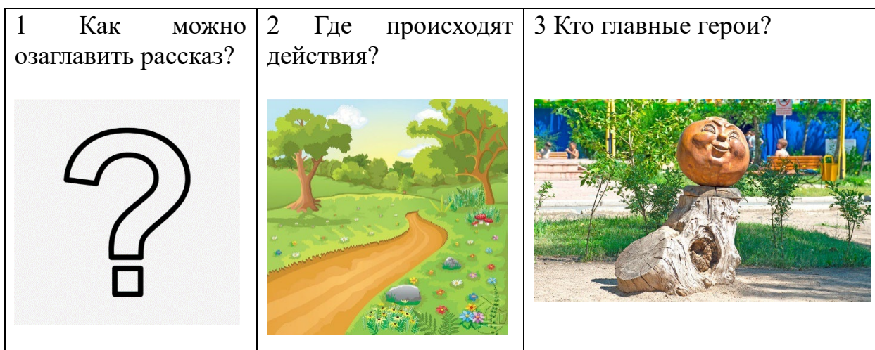
Рисунок Г.1 – Схема составления рассказа