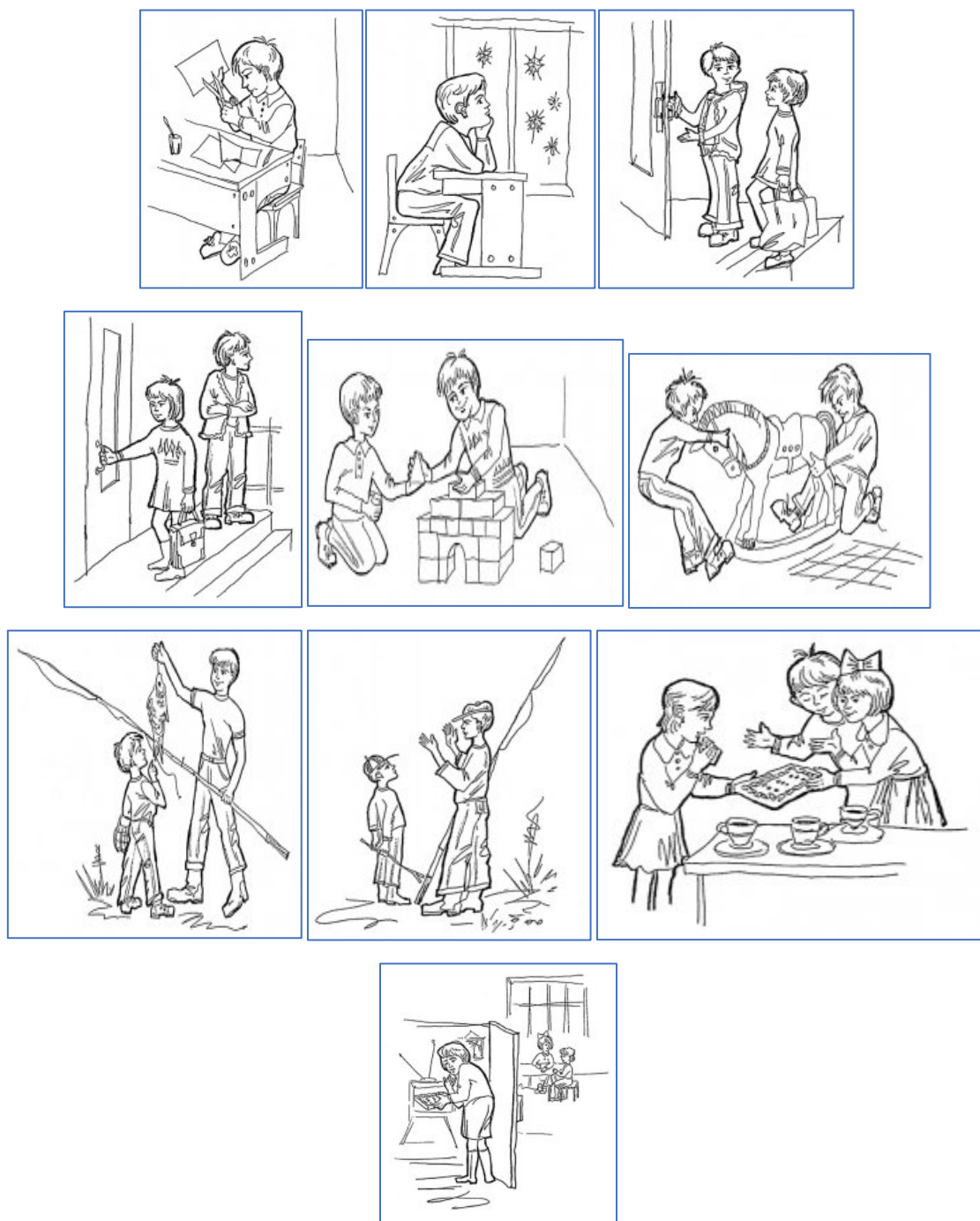
Рисунок Б.1 – Стимульный материал