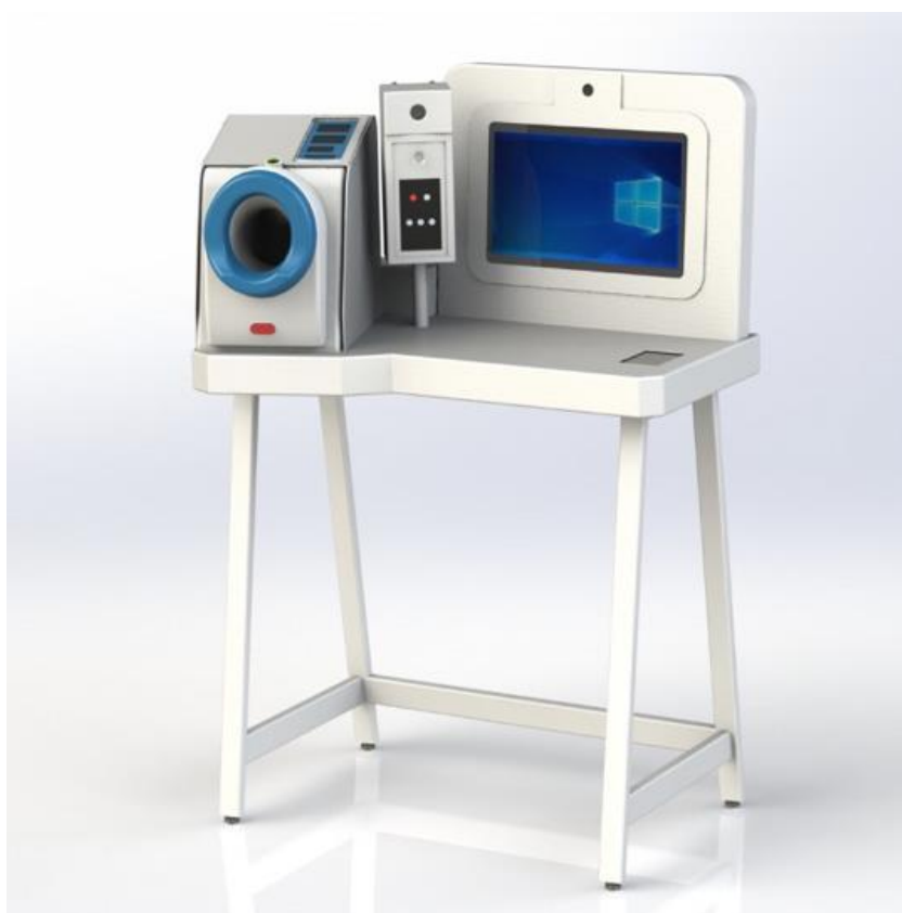
Рисунок 2 – Программно-аппаратный комплекс

Для автоматизации медосмотров используются специально разработанные терминалы, которые представляют собой программно-аппаратные комплексы, состоящие из медицинского оборудования и программного обеспечения (рисунок 2).