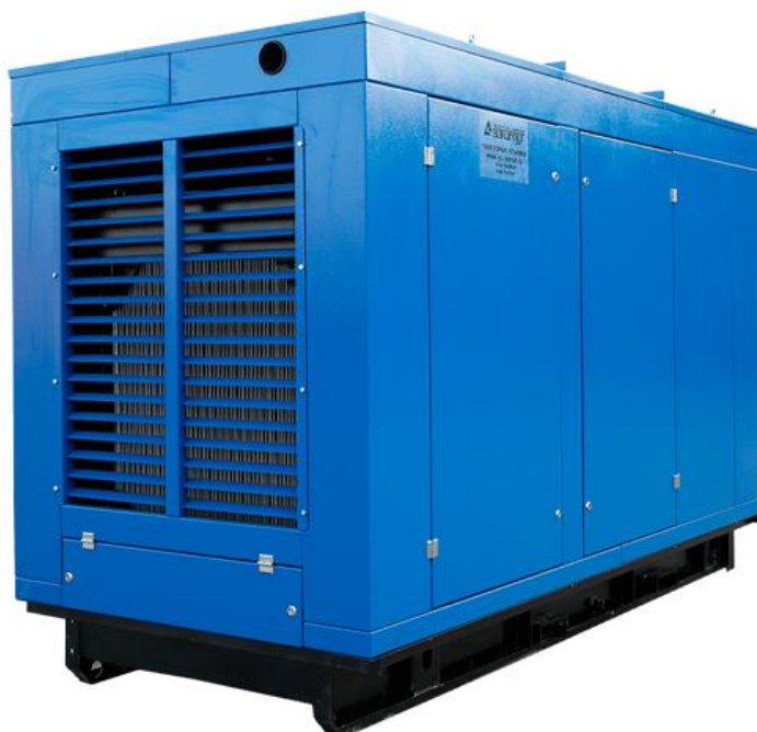
Рисунок 3 - Внешний вид выбранной ДЭС ЭД300С-Т400-2РН

Электростанция дизельная ЭД300С-Т400-2РН в блочно-модульном здании в комплекте. Внешний вид выбранной ДЭС приведен на рисунке 3.