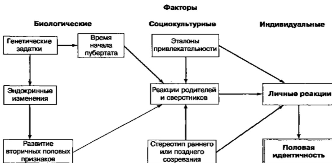
Рисунок 1 – Схема Петерсона и Мейлора о формировании полоролевой идентичности

На схеме Петерсона и Мейлора (рисунок 1) мы отчетливо видим, каким образом происходит становление полоролевой (гендерной, половой) идентичности (с учетом факторов и механизмов) [13].