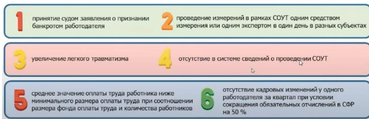
Рисунок 1 – Индикаторы риска нарушения обязательных требований

Перечень индикаторов риска нарушения обязательных требований, разработанный Рострудом, представлен на рисунке 1.