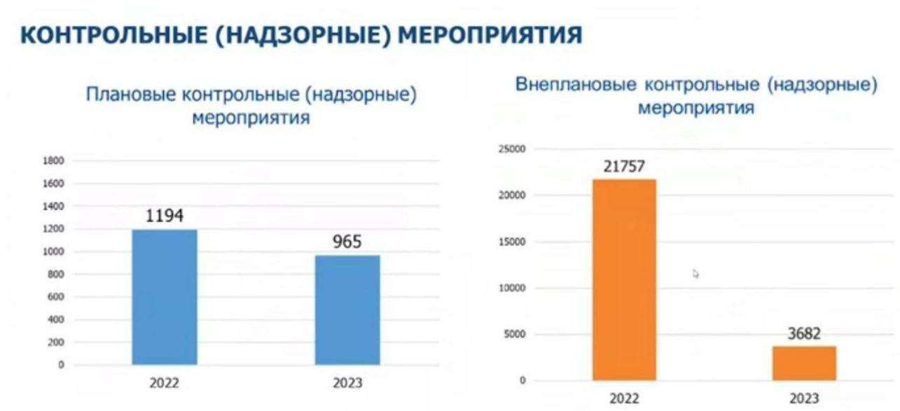
Рисунок 3 – Соотношение количества контрольных мероприятий в 2022г. и в 2023г.

В 2023 году территориальными органами Роструда проведено 965 плановых проверок (рисунок 3). Это обусловлено всеобщей тенденцией к снижению административного давления на работодателей и снижением общего количества контрольных мероприятий.