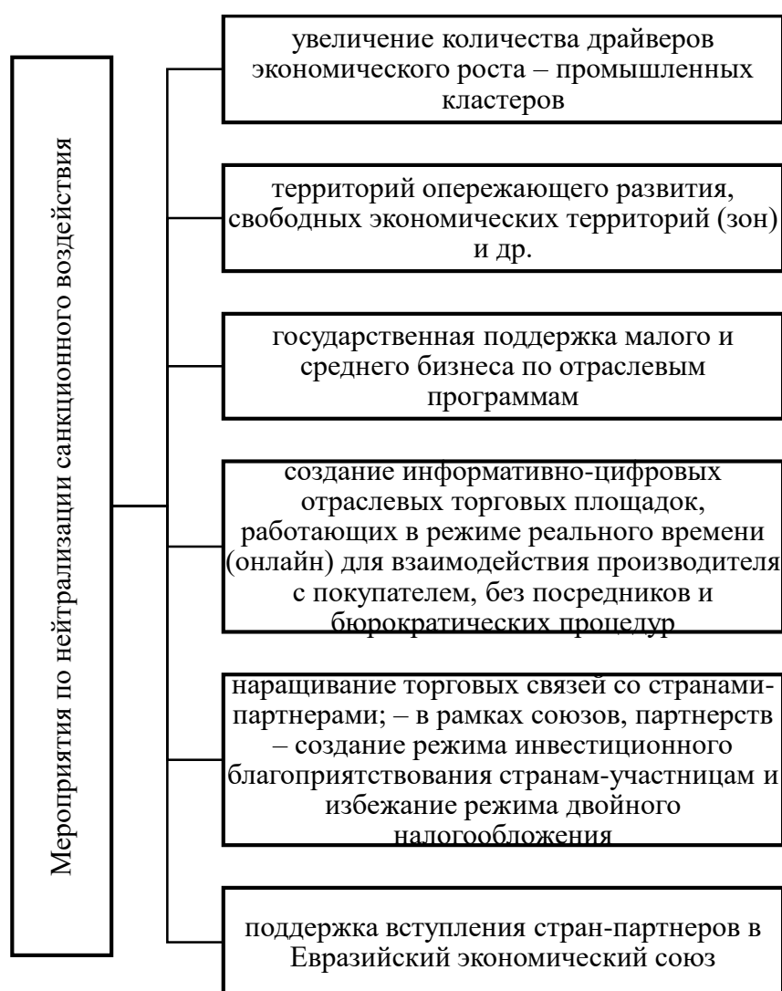
Рисунок 4 – Мероприятия по нейтрализации санкционного воздействия [34, с. 55].

В 2022–2023 гг. РФ активно осуществляет мероприятия по нейтрализации санкционного воздействия, среди которых (рис. 4):