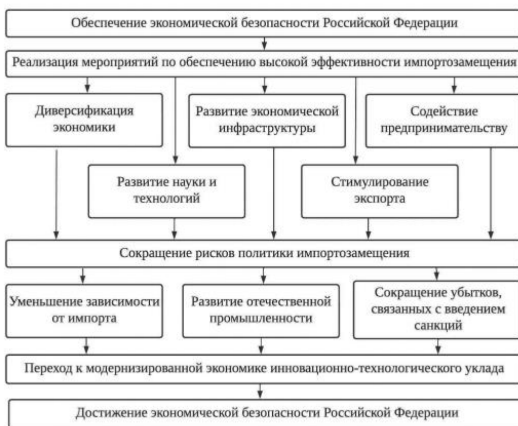
Рисунок 5 – Стратегия обеспечения экономической безопасности в условиях импортозамещения

Реализуемая в настоящее время стратегия обеспечения экономической безопасности должна обеспечить повышение эффективности государственной политики импортозамещения, поскольку замещение импорта товарами, произведёнными внутри страны, является не только одним из инструментов смягчения негативного санкционного давления, но и драйвером экономического роста экономики РФ. С использованием метода систематизации разработаны основные направления совершенствования стратегии экономической безопасности России (рис. 5).