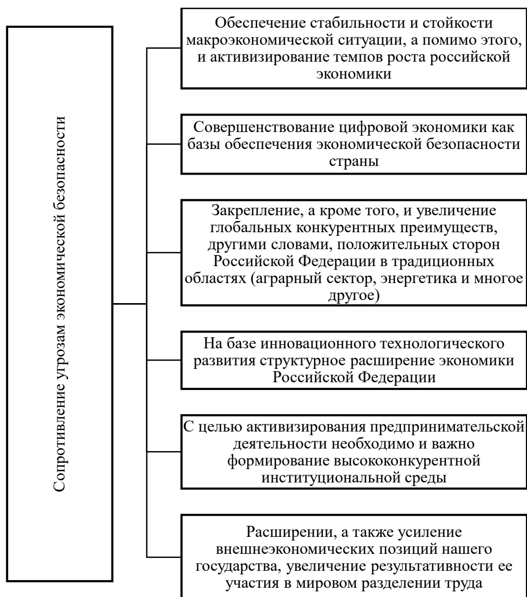
Рисунок 6 – Сопrotивление угрозам экономической безопасности

Важно и нужно в настоящий момент, когда экономика Российской Федерации находится в периоде глобализации, сосредоточить свой интерес на увеличении конкурентоспособности российских производителей для обеспечения экономической безопасности в нашей стране. Все это должно реализоваться в рамках таких направлений как: