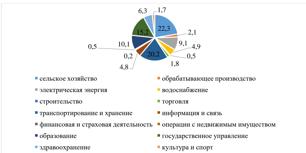
Рисунок 2 – Структура инвестиций в основной капитал по видам экономической деятельности за январь-сентябрь 2022 гг., %

Структура инвестиций в основной капитал по видам экономической деятельности за январь-сентябрь 2022 гг. представлена на рисунке 2.