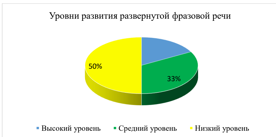
Рисунок 1 – Результаты констатирующего эксперимента

Графически результаты констатирующего эксперимента представлены на рисунке 1.