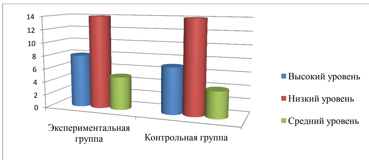
Рисунок 2–Результаты исследования уровня познавательной деятельности на констатирующем этапе эксперимента.

Наглядно результаты данной диагностики можно увидеть на рисунке 2.