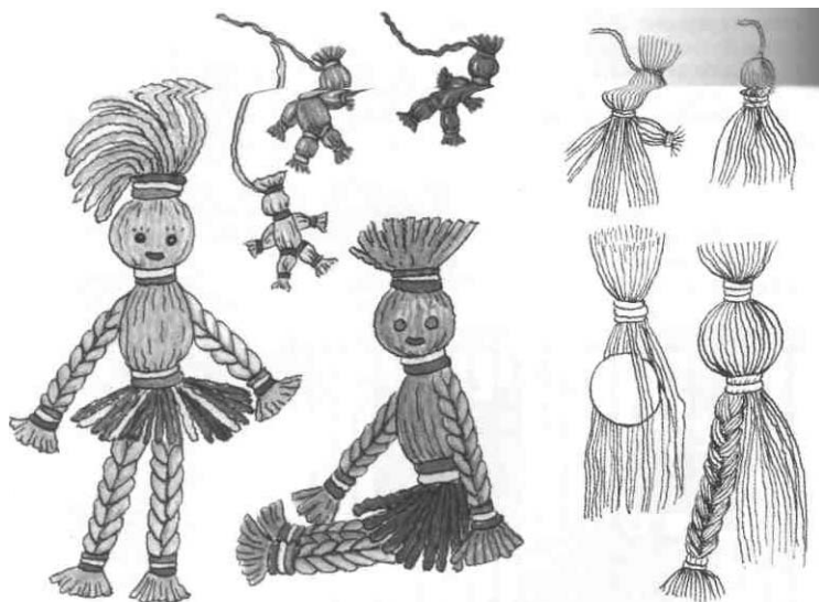
Рис. 3. Игрушки из обрезков ниток

Веселые фигурки меньшего размера станут оригинальным украшением детского платяца (рис. 3).