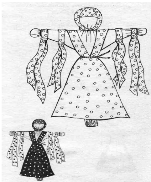
Рис. 2. Вариант оформления костюма «Купавка»

Таким же образом выполнялась кукла Купавка. На рукавах у нее вязывали яркие лоскуты и ленты (рис. 2). Это была кукла одного дня, бытовавшая в Рязанской, Тульской, Владимирской и Калужской губерниях. Купавка олицетворяла начало купаний. Ее сплавляли по воде, и тесемки, привязанные к ее рукам, забирали с собой людские болезни и невзгоды – такое значение придавалось очистительной силе воды. Это кукла праздников Аграфены Купальницы и Ивана Купала (6 и 7 июля по новому стилю).