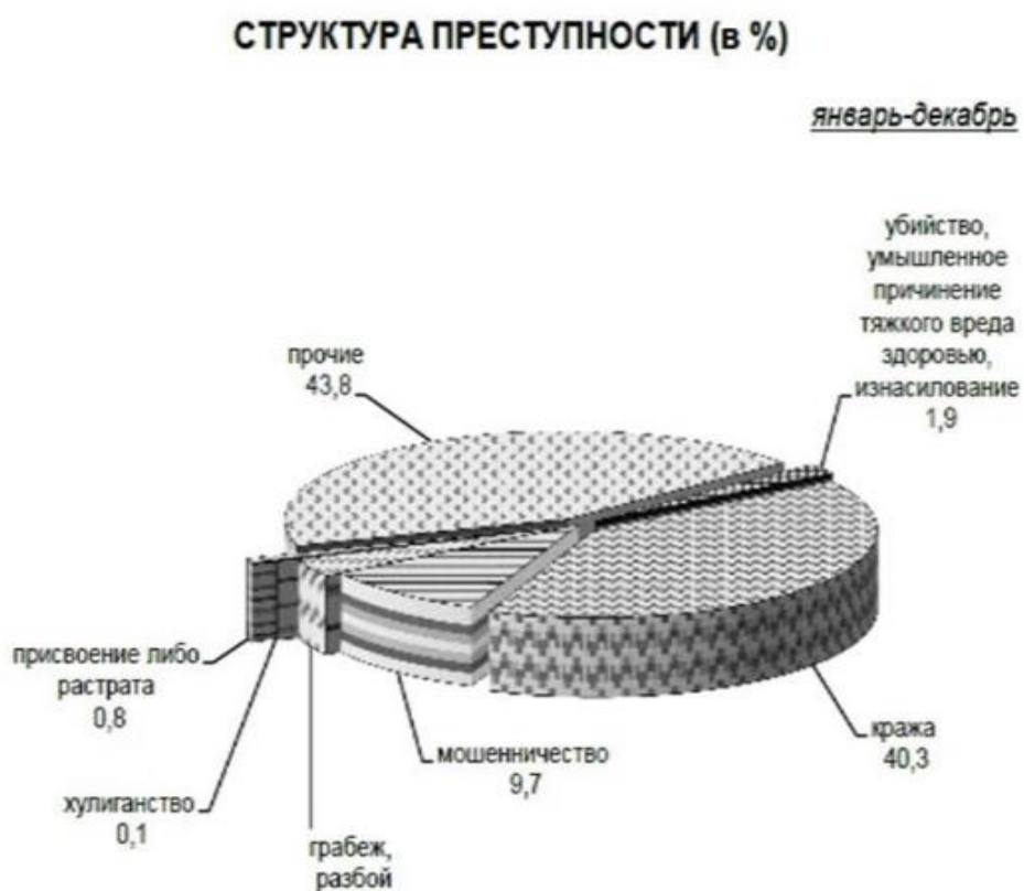
Рисунок В.1 – Статистика преступлений против собственности