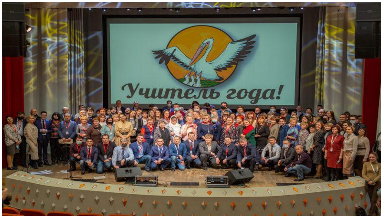
Рисунок 2 – Эмблема конкурса «Учитель года»

Официальной эмблемой конкурса является пеликан, распростерший крылья над своими птенцами. Использование официальной эмблемы конкурса обязательно на всех этапах конкурса (рисунок 2).