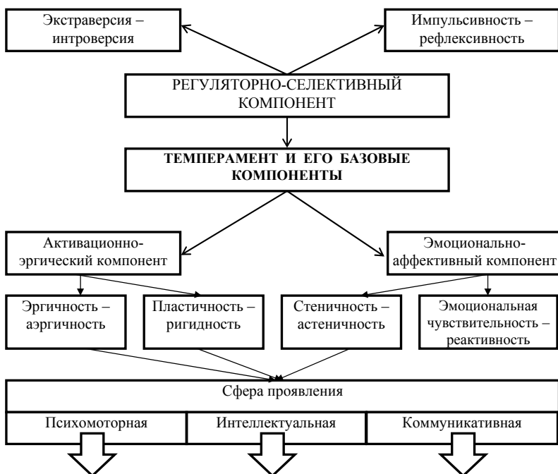
Рис. 2. Темперамент и его базовые компоненты

Инструкция: «Вам предлагается ответить на 57 вопросов. Вопросы направлены на выявление вашего обычного способа поведения. Постарайтесь представить типичные ситуации и дайте первый «естественный» ответ, который придет вам в голову. Отвечайте быстро и точно. Помните, что нет «хороших» или «плохих» ответов. Если вы согласны с утверждением, поставьте рядом с его номером знак «+» (да), если нет, то знак «-» (нет)».