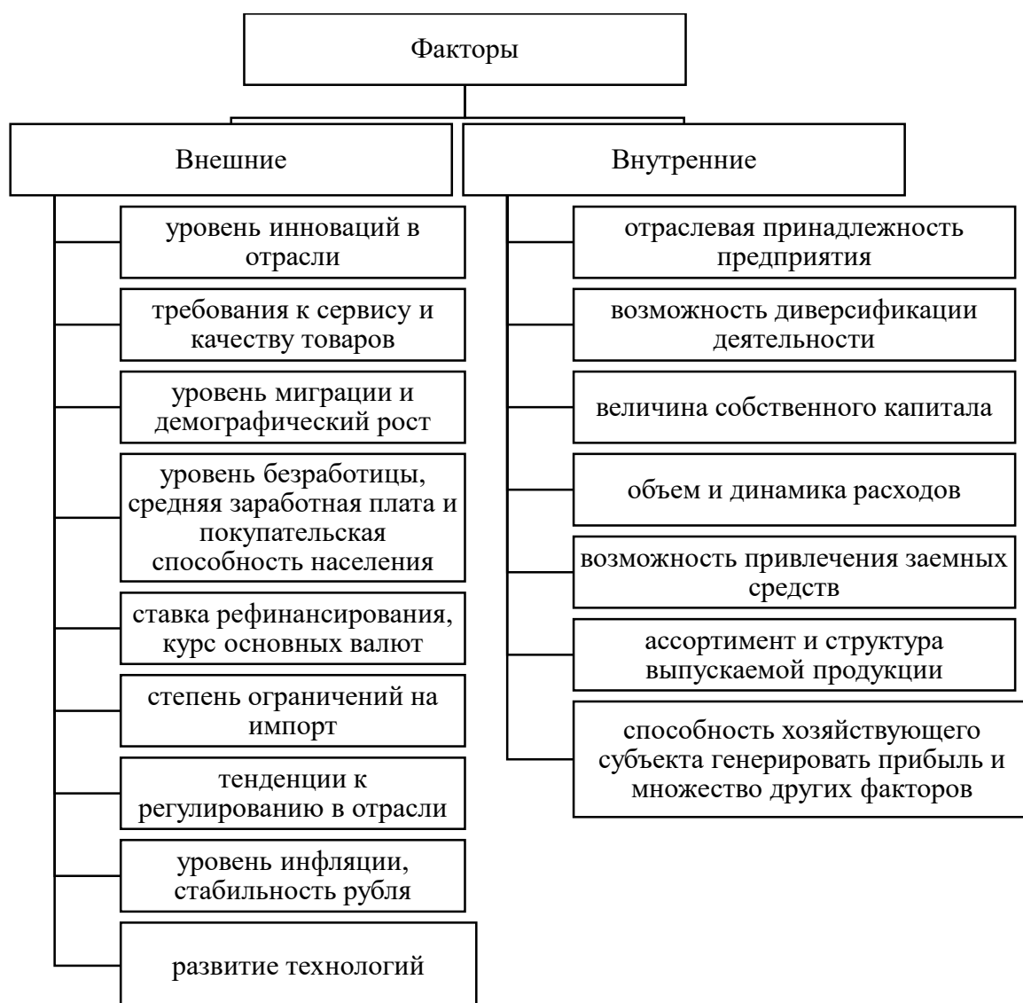
Рисунок 2 – Факторы влияния на финансовую устойчивость предприятия (по Н. П. Котеровой)

«Финансовая устойчивость предприятия формируется под влиянием факторов внутренней и внешней среды. В.В. Карпеева подразделяет на экономические и неэкономические (политические, правовые, экологические), которые, в свою очередь, подразделяются по способам влияния и могут быть прямыми и косвенными» [15]. На рисунке 2 показана важность уровня влияния этих факторов, соотношения внешних и внутренних факторов, при рассмотрении в целом системы экономики и при рассмотрении определенных субъектов экономики.