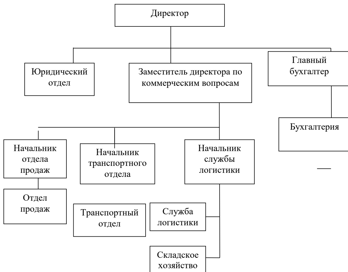
Рисунок 4 - Организационная структура ООО «ТК «Регионы»

На рисунке 4 приведена схема организационной структуры ООО «ТК «Регионы».