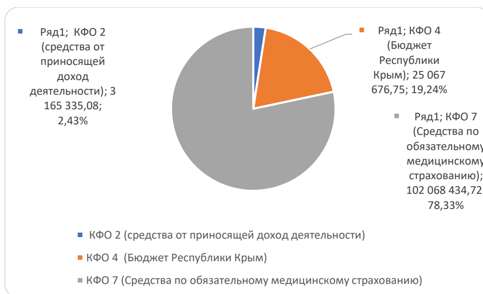
Рисунок 1 – Удельный вес средств на закупку материальных запасов медицинского назначения, 2019 год.

На основании распределения денежных средств, затраченных в 2019 году на закупку материальных запасов медицинского назначения (таблица 11), построим диаграмму по определению удельного веса истраченных средств (рисунок 1).