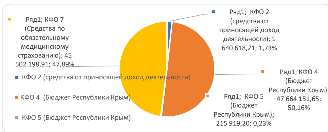
Рисунок 3 – Удельный вес средств на закупку материальных запасов медицинского назначения, 2021 год.

до 1,73 %, что меньше средств, затраченных на приобретение материальных запасов медицинского назначения в 2019 и 2021 годах.