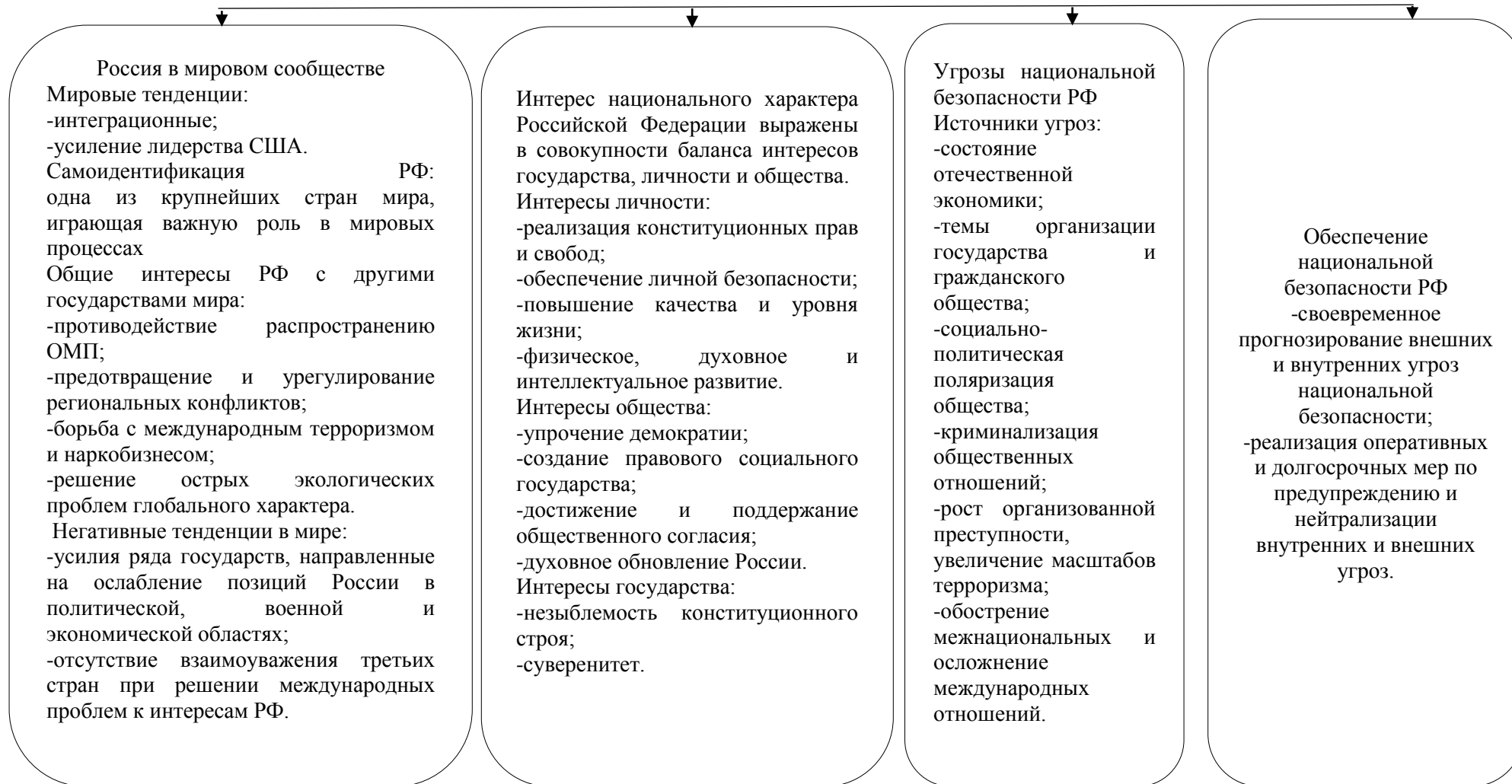
Рисунок 4 – Концепция национальной безопасности РФ