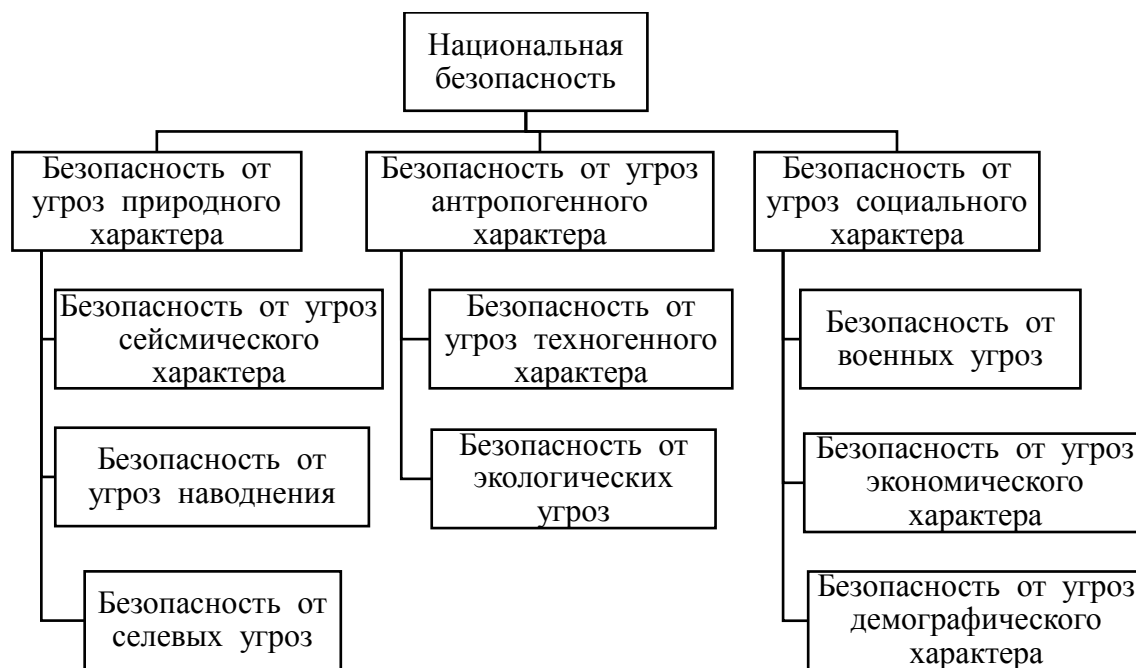
Рисунок 2 – Классификация видов национальной безопасности по характеру угроз

конкретизацию вида безопасности той или иной угрозы. На рисунке 2 представлена суть видов национальной безопасности по характеру угрозы, раздробленная на мелкие виды [3, с. 69].