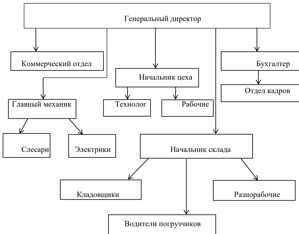
Рисунок 2 – Организационная структура ООО «Поликомдекор»

Миссия организации – стать лучшим поставщиком полимерных композиционных материалов по соотношению «цена – качество».