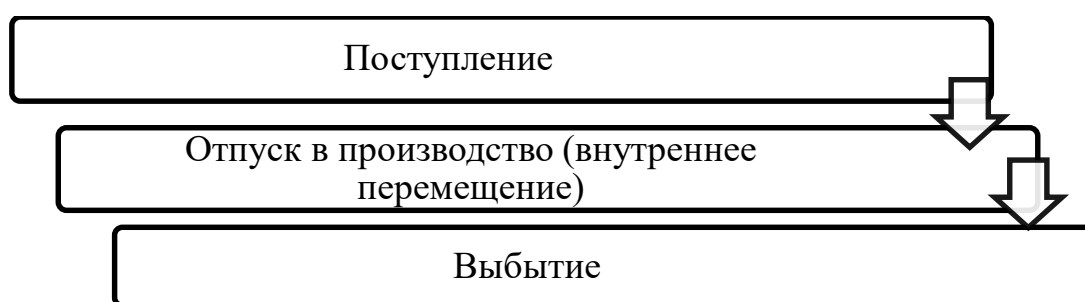
Рисунок 1 – Стадии движения МПЗ

Как правило, в ходе осуществления хозяйственной деятельности предприятия МПЗ проходят три стадии движения. Некоторые МПЗ, проходят только две стадии. Данные об основных стадиях движения МПЗ представлены на рисунке 1.