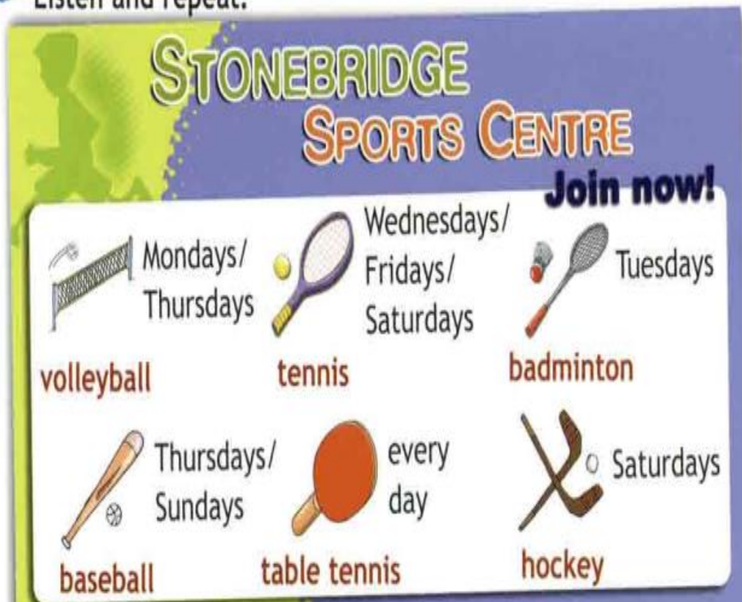
Рисунок А.1 – Пример упражнения на тему «Спорт»