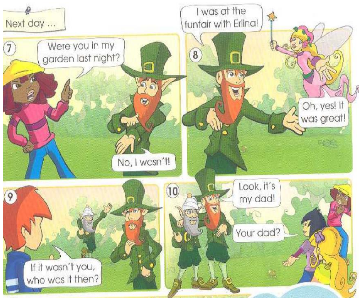
Рисунок Г.1 – Пример комикса