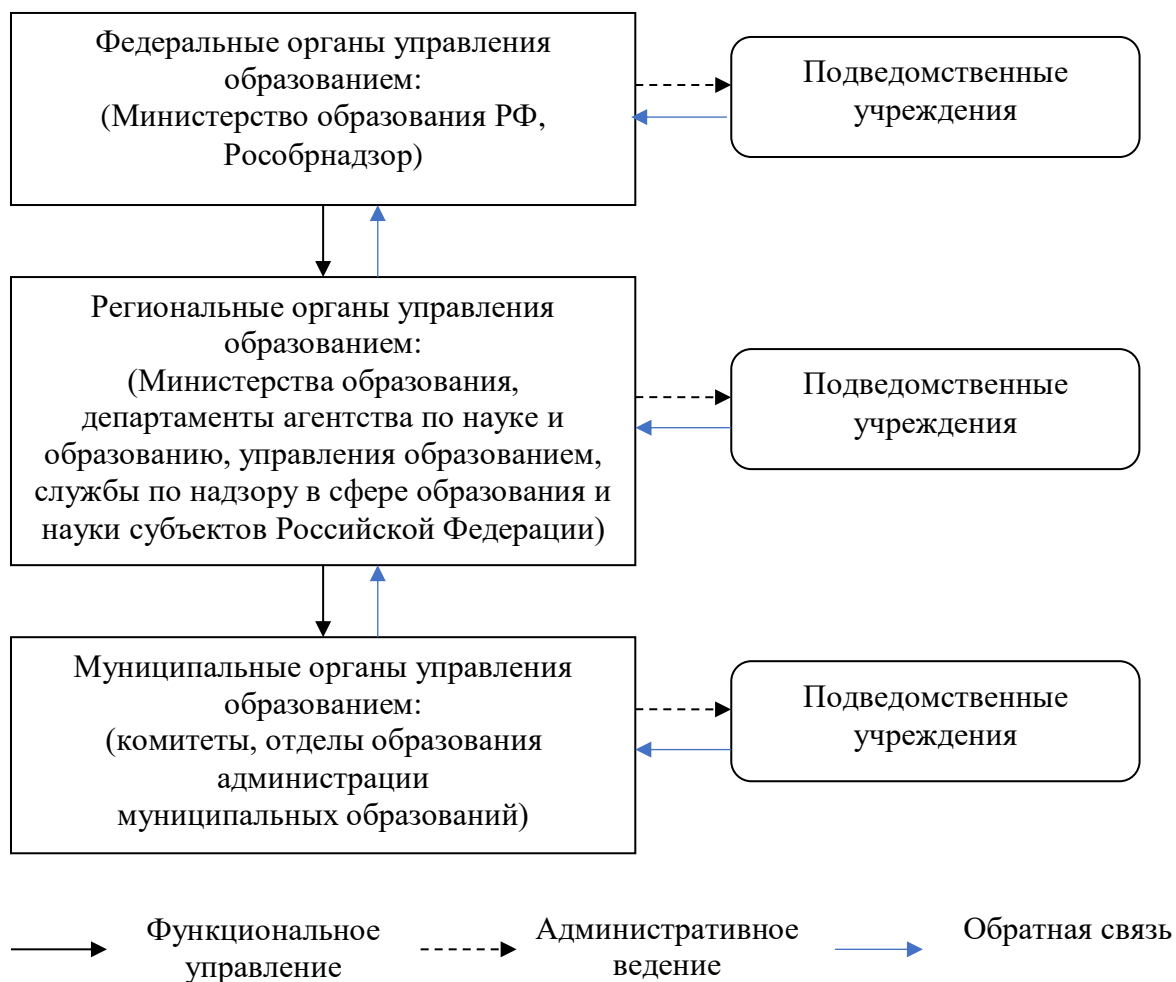
Рисунок 4 – Усовершенствованная модель управления системой образования

Для решения последнего пункта проблем предлагается внедрение усовершенствованной модели управления системой образования в Российской Федерации (рисунок 4).