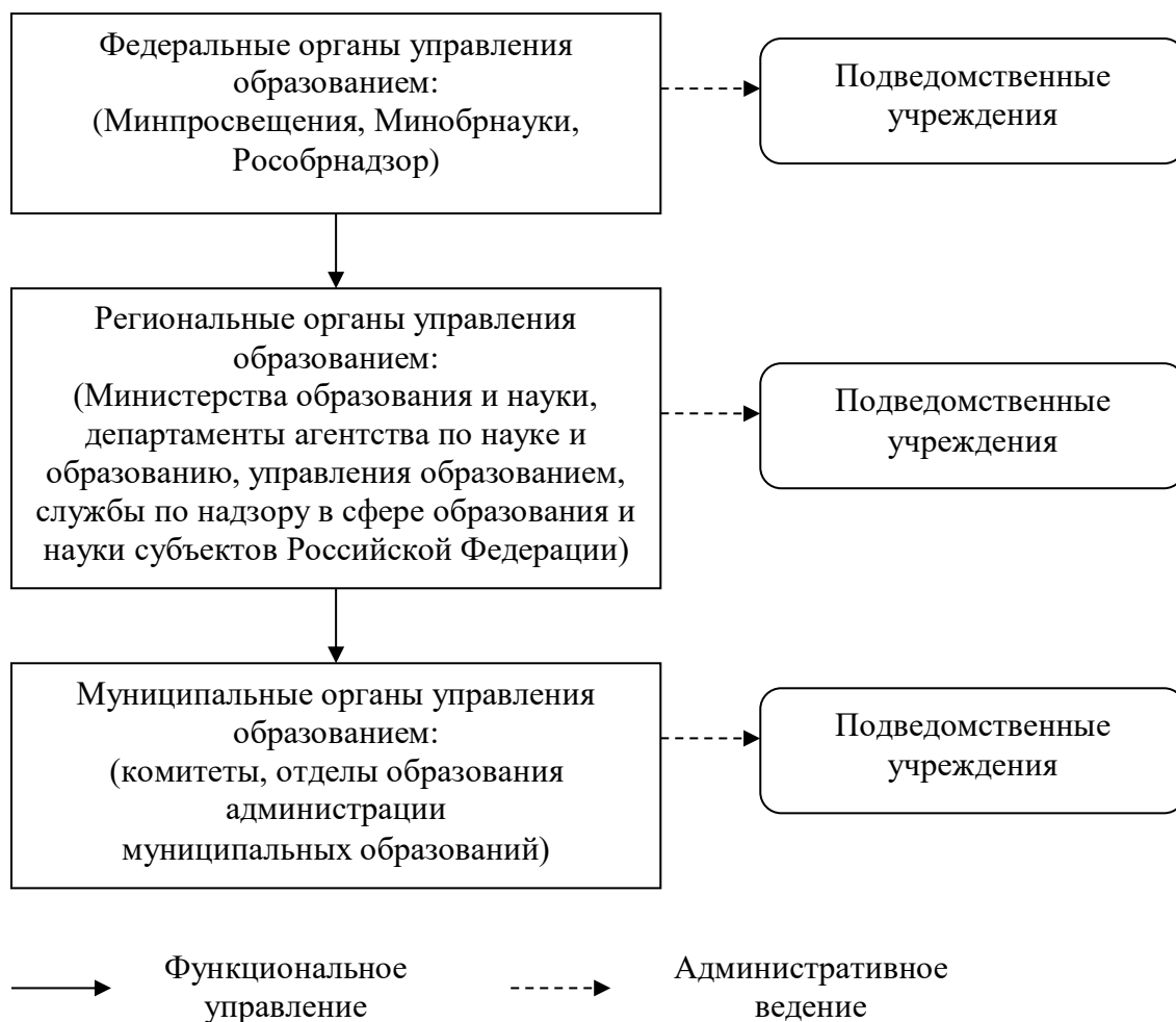
Рисунок 2 - Обобщенная структура управления образованием [63]

Обобщенная структура управления образованием в Российской Федерации изображена на рисунке 2.