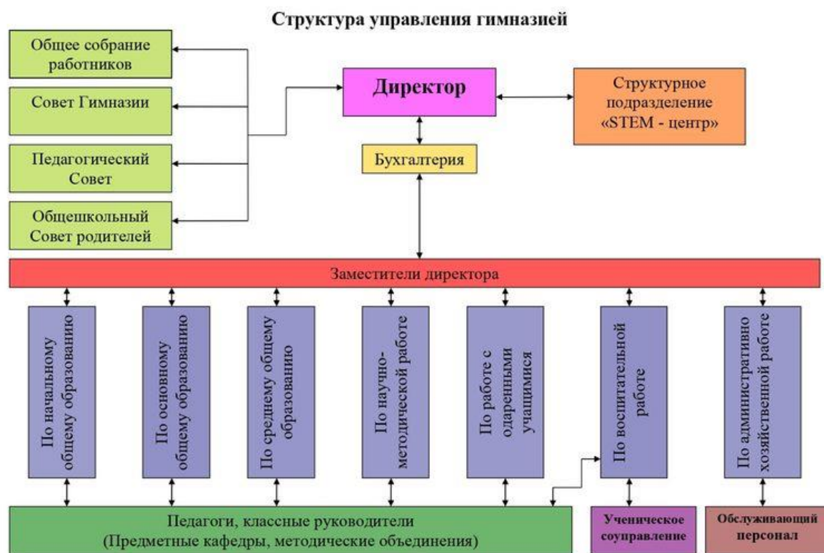
Рисунок А.1 – Организационная структура МБОУ г.о. Тольятти «Гимназия №77»