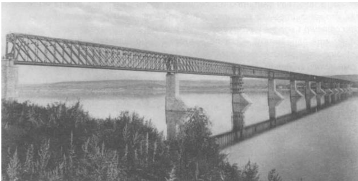
Рисунок Г.1 – Александровский мост через р. Волгу