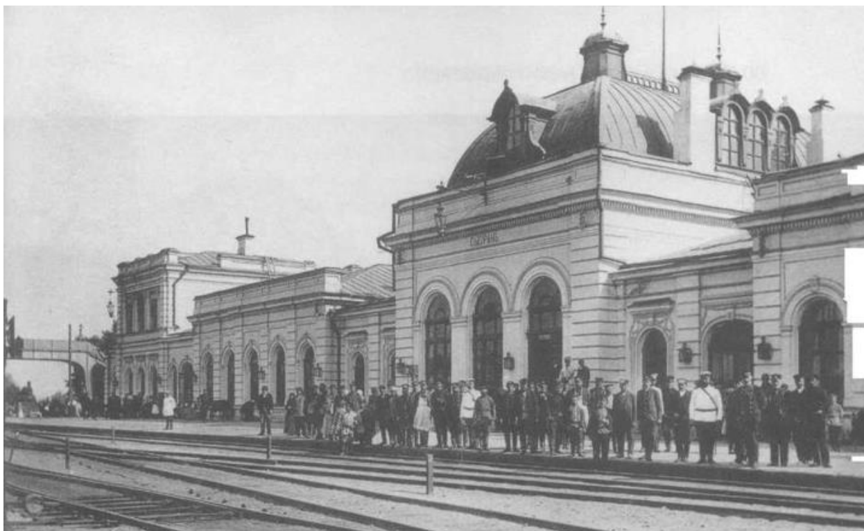
Рисунок В.1 – Старинный вокзал Сызрани