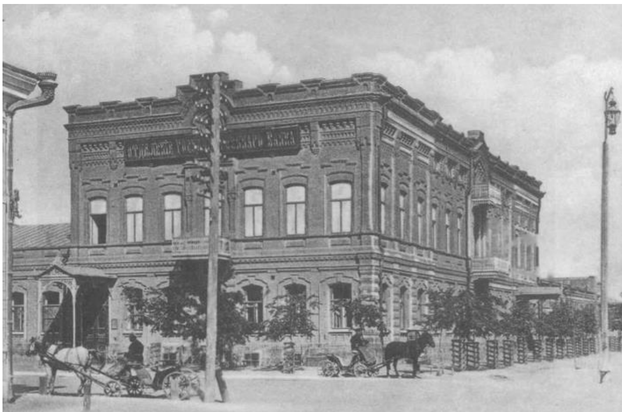
Рисунок Ж.1 – Здание отделения Государственного банка