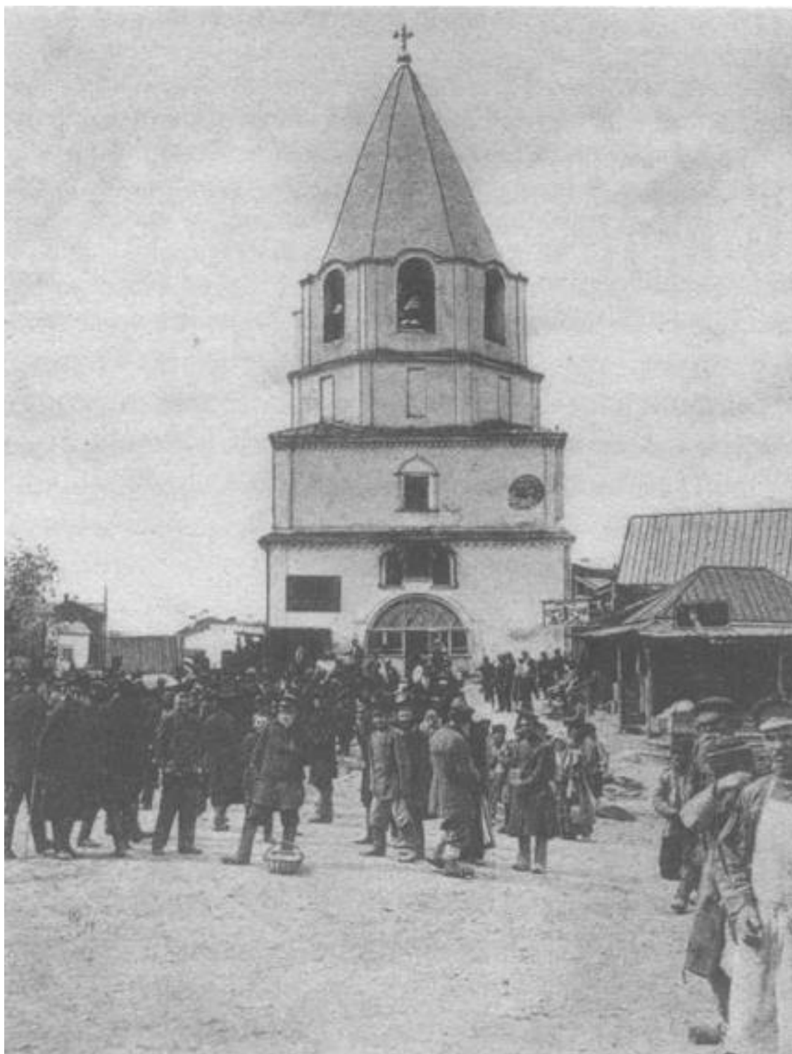
Рисунок Б.1 – Сызранский Кремль