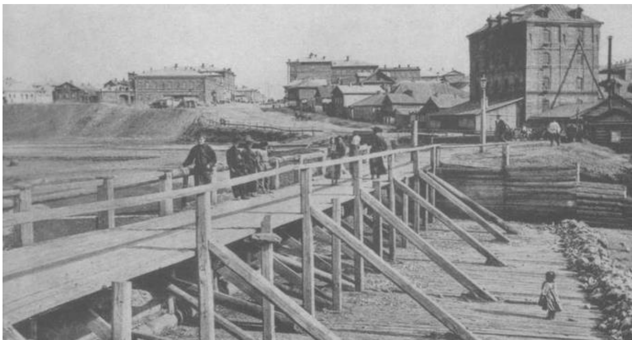
Рисунок Д.1 – Вид на городскую мельницу, ныне здание утрачено. Мост через р. Крымзу