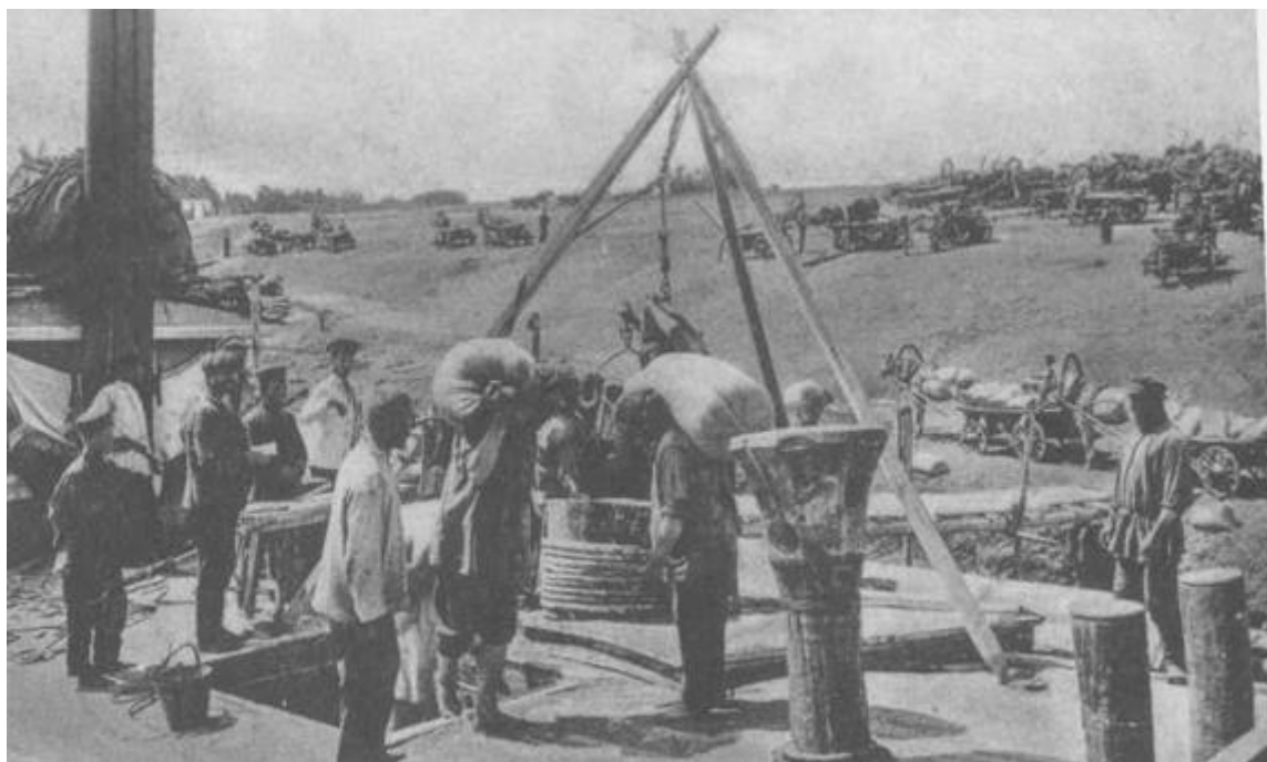
Рисунок Е.1 – Грузчики, извозчики и приказчики были самыми востребованными профессиями на местном рынке труда

Грузчики, извозчики и приказчики были самыми востребованными профессиями на местном рынке труда