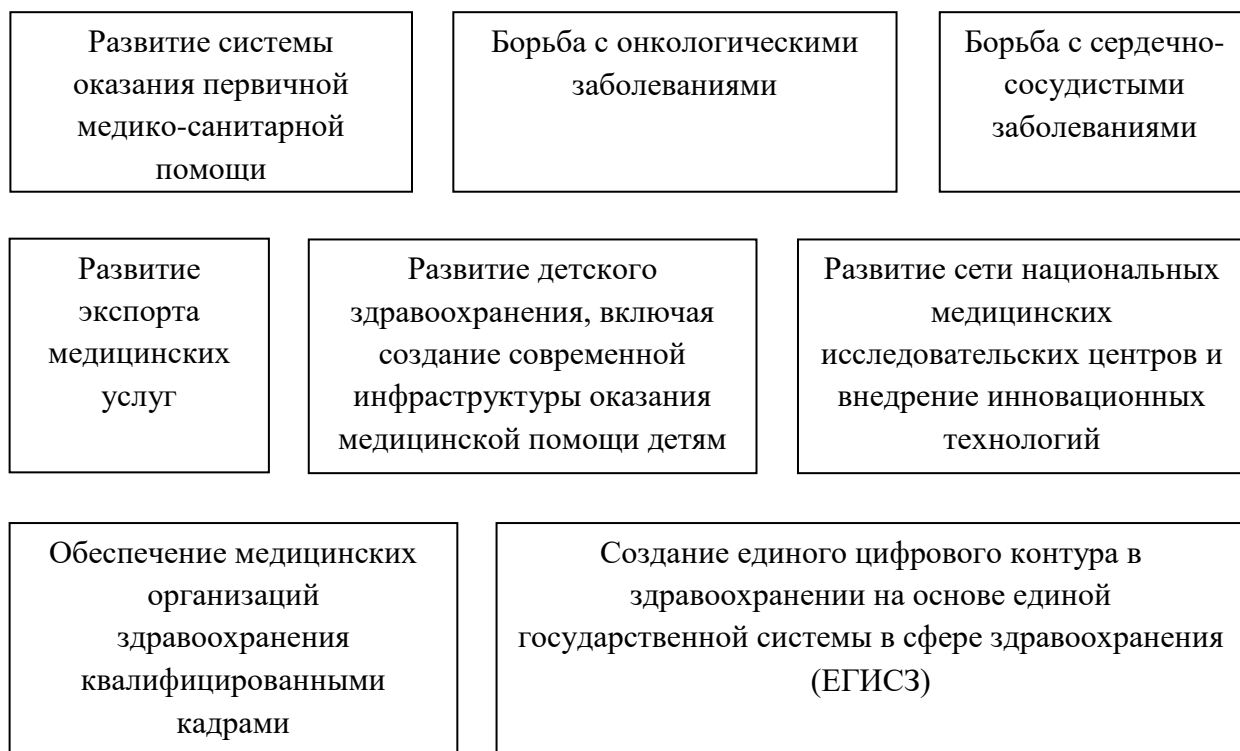
Рисунок 1 – Федеральные проекты национального проекта «Здравоохранения» как стратегические направления развития системы здравоохранения

первичном звене, включая труднодоступные районы страны и сельскую местность. До 2024 г. запланировано строительство более 360 новых объектов сельского здравоохранения – ФАПов, врачебных сельских амбулаторий; обновление более 1,2 тыс. объектов и закупка мобильных медицинских комплексов для населённых пунктов, где проживают менее 100 человек. Всё это делается для того, чтобы в населённых пунктах с численностью жителей более 100 человек первичная медицинская помощь была в шаговой доступности, то есть не более 6 км от места нахождения человека – это примерно час пешком или 15 минут на общественном транспорте. Важно, чтобы при этом более чем в два раза увеличился охват населения профилактическими осмотрами. Задача, поставленная Президентом, — чтобы каждый россиянин мог раз в год пройти профилактический осмотр. Это осмотры должны быть не формальными, количественный рост не должен формализовать профилактические осмотры и диспансеризации» [20, с.136].