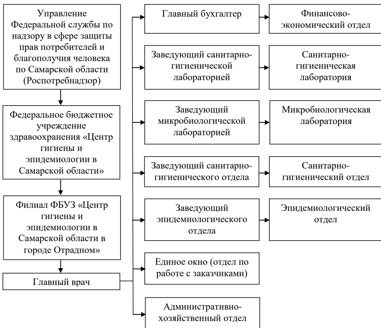
Рисунок 3 – Организационная структура ФФБУЗ «Центр гигиены и эпидемиологии в Самарской области в городе Отрадном»

Руководитель филиала осуществляет текущее руководство деятельностью ФФБУЗ «Центр гигиены и эпидемиологии в Самарской области в городе Отрадном» в соответствии с законодательством Российской Федерации, правовыми актами Федеральной службы, настоящим Положением; распределяет обязанности между своими заместителями; в пределах своей компетенции издает приказы, распоряжения и другие акты по вопросам деятельности филиала.