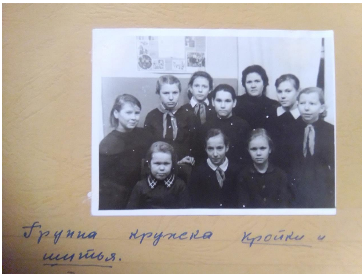
Рисунок А.1 – Фото из архивного альбома Дворца культуры