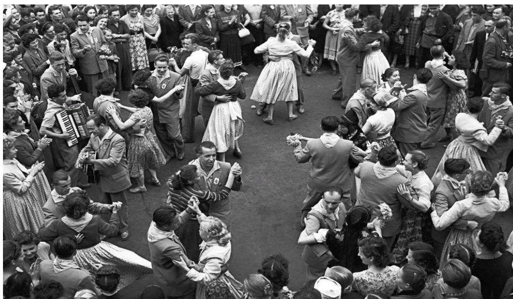
Рисунок 2 – Фотография «Танцы на Всемирном фестивале молодёжи и студентов в Москве»

На фотографии ниже (рисунок 2) очень хорошо отражена атмосфера дружбы. Фото было сделано РИА Новости в 1957 году и называлось «Танцы на Всемирном фестивале молодёжи и студентов в Москве».