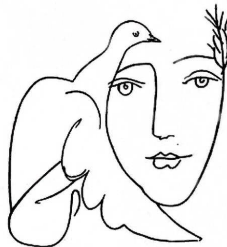
Рисунок 1 – Эмблема Международного фестиваля молодёжи и студентов. П. Пикассо. 1957 год

На фотографии ниже (рисунок 2) очень хорошо отражена атмосфера дружбы. Фото было сделано РИА Новости в 1957 году и называлось «Танцы на Всемирном фестивале молодёжи и студентов в Москве».