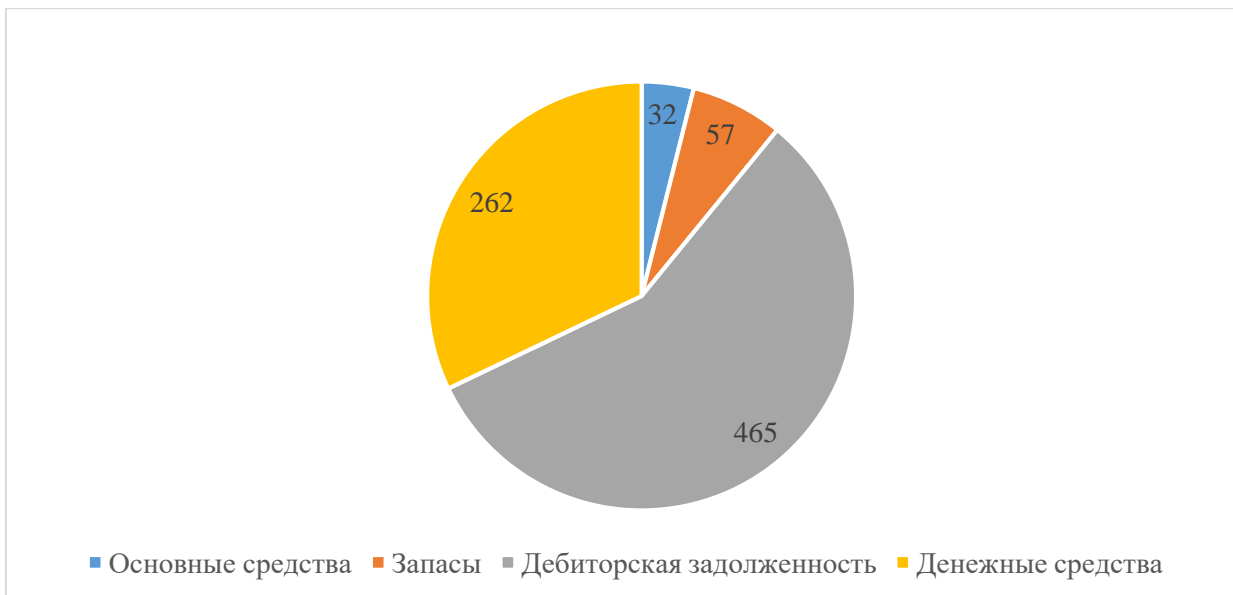
Рисунок 2 – Структура имущества предприятия в 2021 г., в тыс. руб.

При дальнейшем увеличении ее объема сформируются риски зависимости компании от платежей клиентов, что снизит уровень финансовой устойчивости и платежеспособности предприятия. Это делает достаточно актуальным реализацию мероприятий в сфере обеспечения высокой эффективности управления дебиторской задолженностью ООО «Грант-Мастер».