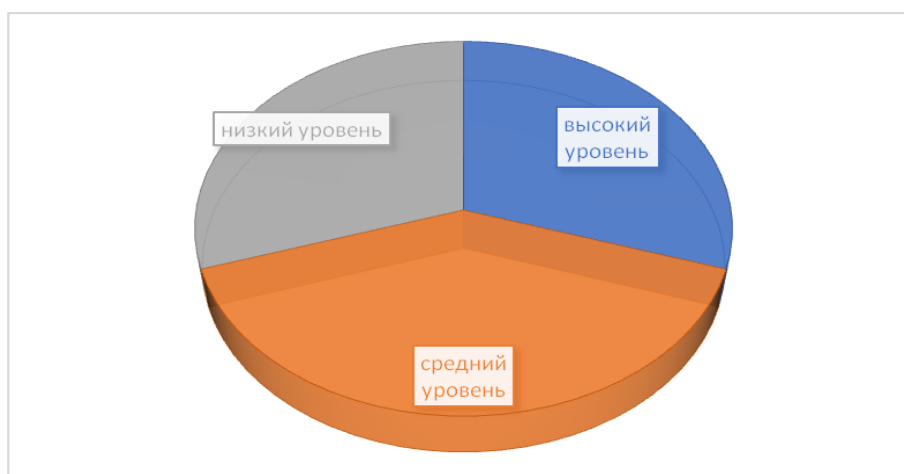
Рисунок 1 – Результаты выявления уровней сформированности у детей 3-4 лет представлений о себе и своей семье на констатирующем этапе

По результатам обработки ответов дошкольников мы получили следующее распределение дошкольников по уровням сформированности представлений о себе и своей семье (рисунок 1, таблица 5).