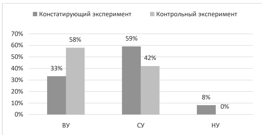
Рисунок 2 – Результаты констатирующего и контрольного экспериментов

В итоге высокий уровень повысился на 25% и составил 58% (7 детей), средний уровень понизился на 16% и стал составлять 42% (5 детей). Низкий уровень понизился до 0%.