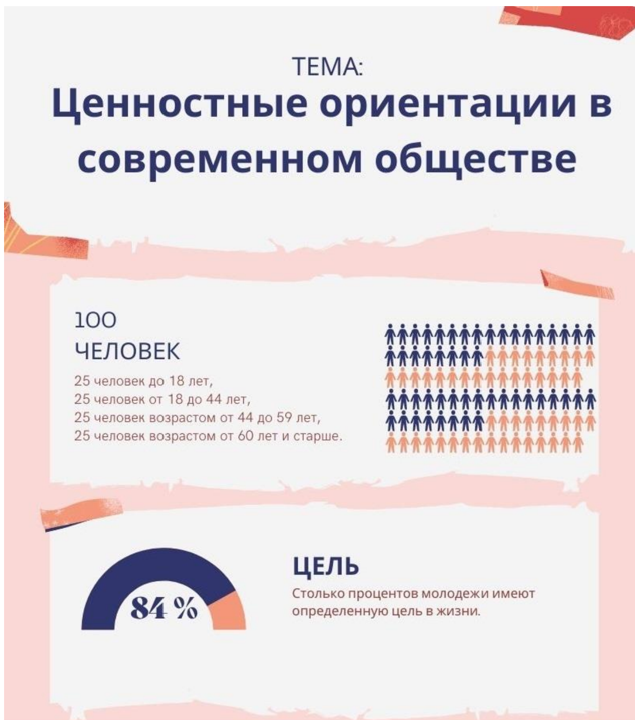
Рисунок Г.1 – Результаты анкетного опроса