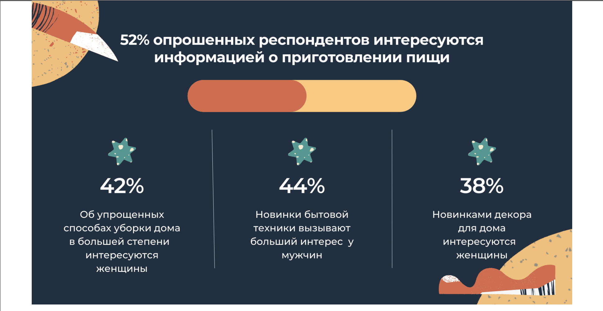
Рисунок 3 – Инфографика мнение респондентов о организации быта.