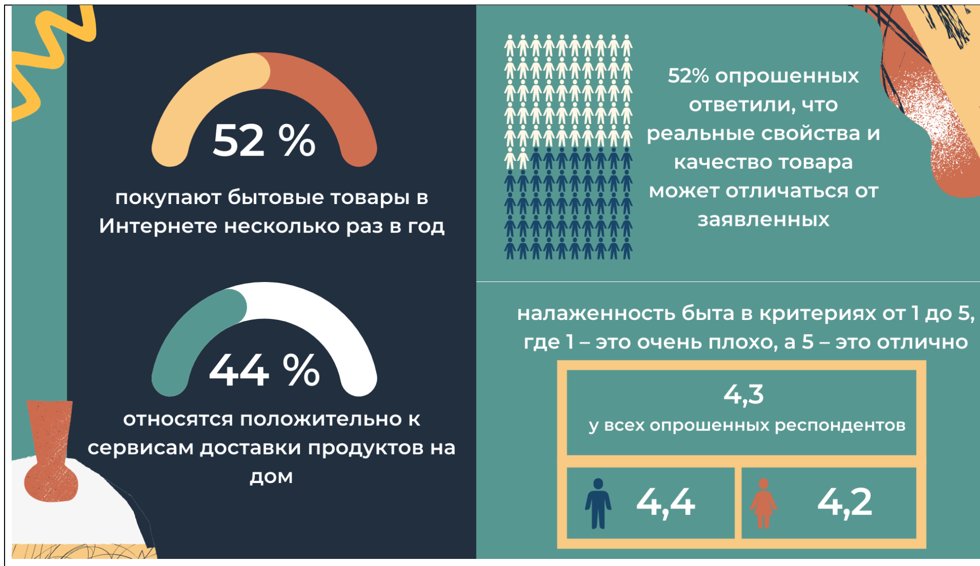
Рисунок 6 – Инфографика как респонденты относятся к сервисам по доставке продуктов и наладженности быта.