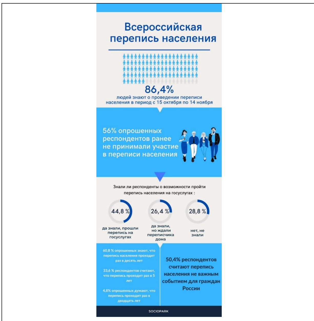
Рисунок 1 – Инфографика «Всероссийская перепись населения».

Также в рамках «Всероссийской переписи населения 2021» совместно с проектом кафедры «Социология» Тольяттинского государственного университета «SocioPark» было проведено социологическое исследование и подготовлена инфографика с результатами опроса. На рисунке 1 представлена инфографика «Всероссийская перепись населения».