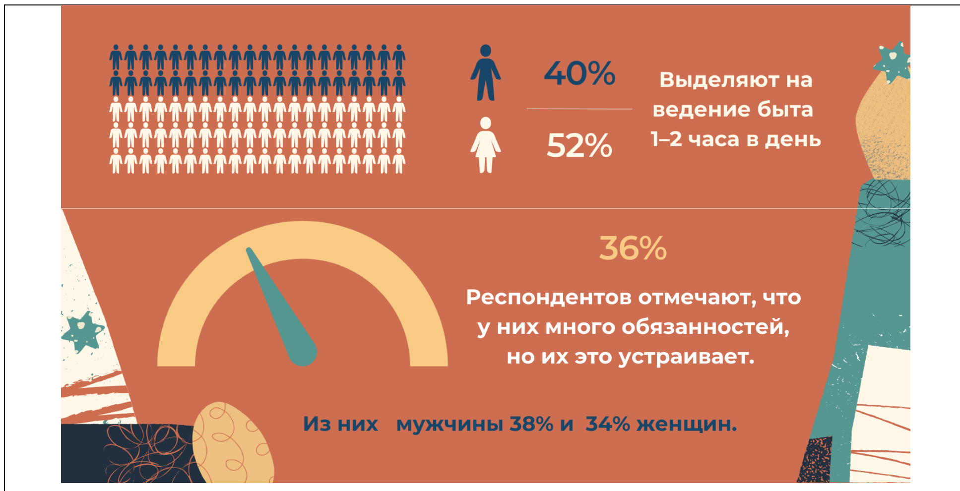
Рисунок 4 – Инфографика отношение опрошенных респондентов в вопросе домашнего быта.