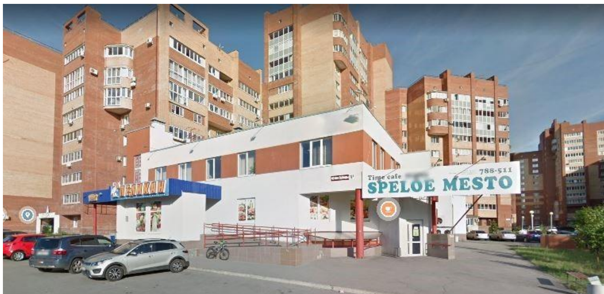
Рисунок 2 – Здание кафе

Помещение, в котором планируется расположить кафе находится в отдельно стоящем здании, к которому есть удобный заезд, а рядом парковочная зона для автомобилей (рис. 2).