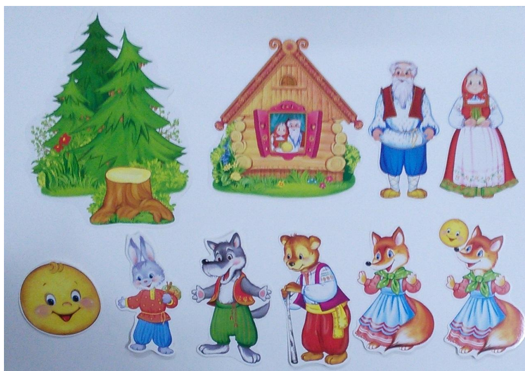
Рисунок Г.1 – Примеры картинок для ОД